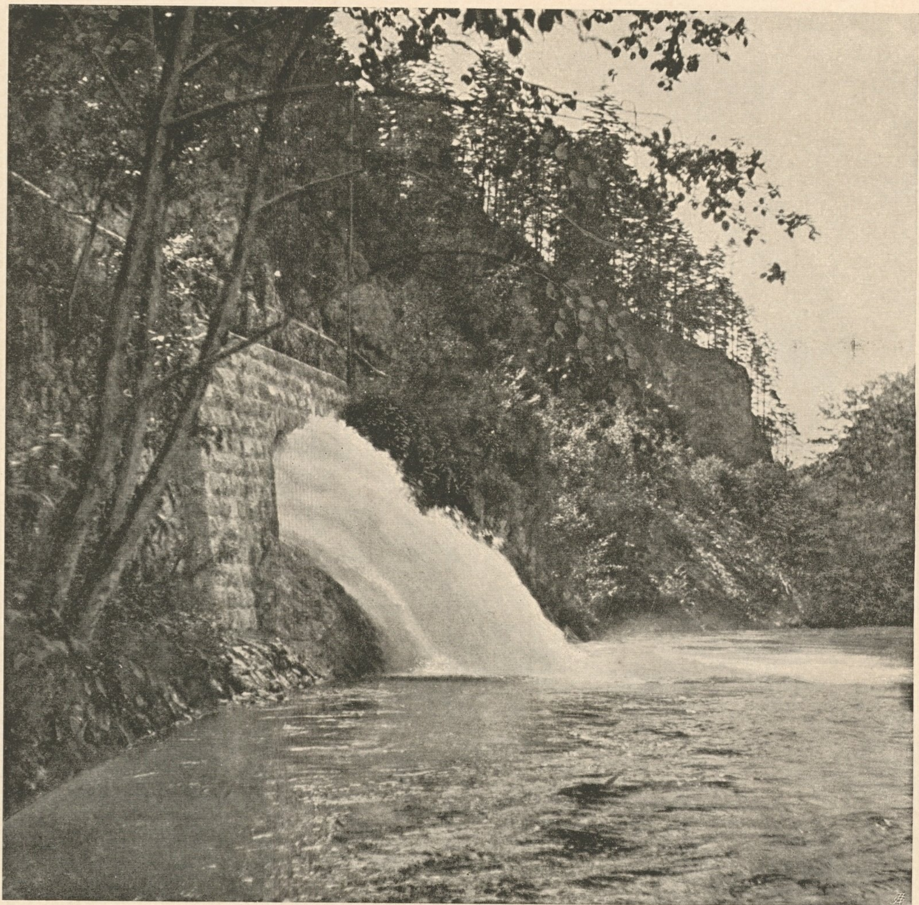
Nr. 5. Ablass in die Salza.