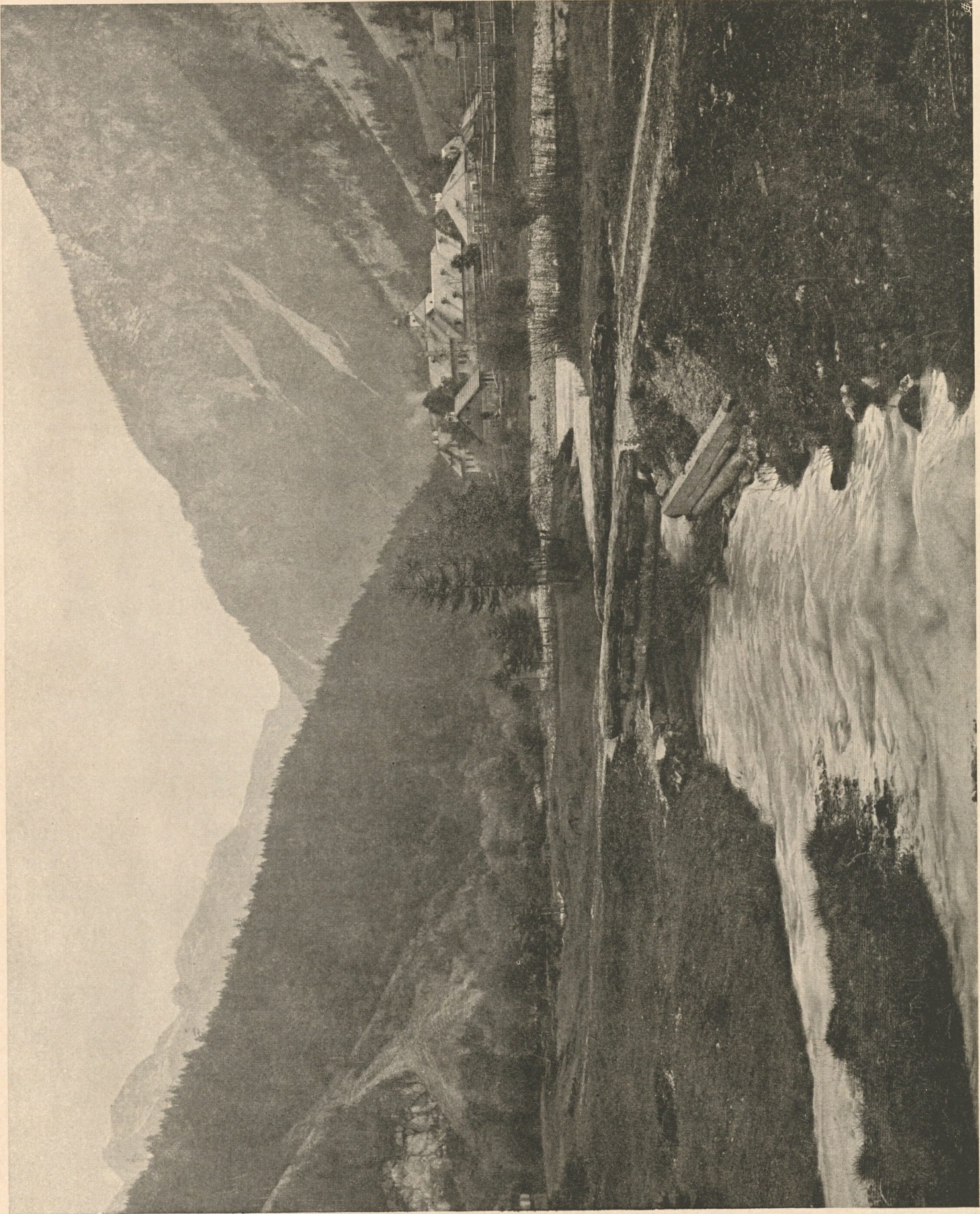
Nr. 4. Weichselboden mit der Einnündung des Höllbaches in die Salza.