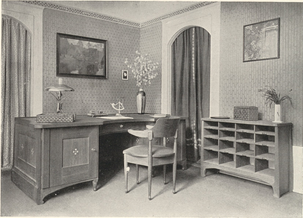
PROFESSOR RICHARD RIEMERSCHMID — MÜNCHEN. HERRENZIMMER-MÖBEL. SCHREIBTISCH U. AKTENSTÄNDER. AUSF.: DEUTSCHE WERKSTÄTTEN FÜR HANDWERKSKUNST - DRESDEN.