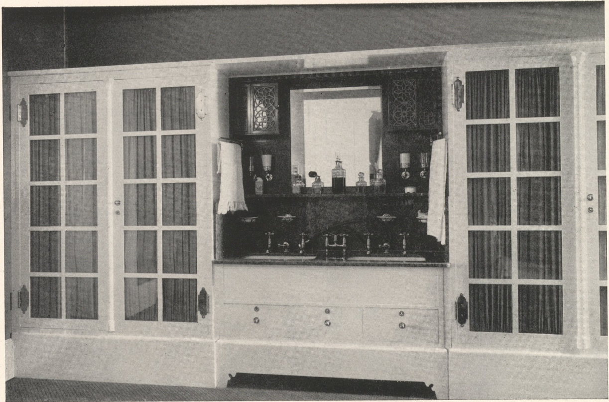
ARCHITEKT EDUARD PFEIFFER—BERLIN.