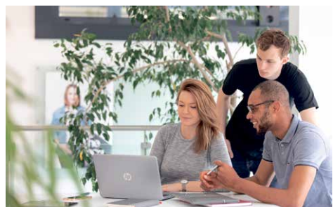
Reichen Sie Ihr Projekt für eine Anschubfinanzierung ein!

gen. Die 12. Runde der Anschubfinanzierungen startete Mitte September – Einreichungen sind bis Mitte November möglich.