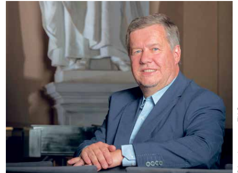
Gernot Kubin ist für weitere drei Jahre Senatsvorsitzender der TU Graz.