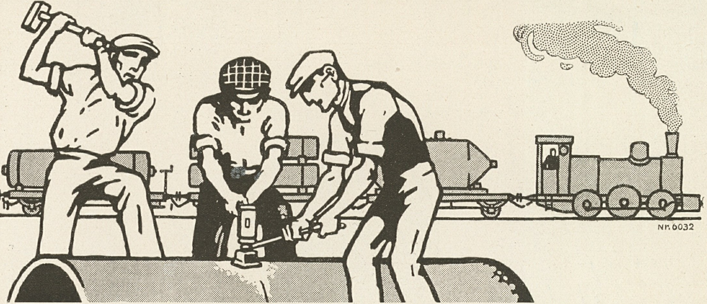
Abb. 134 1. Einfache Kupplung der Räder mit verschiedenem Durchmesser. (Aus der Anzeige einer bekannten deutschen Firma)