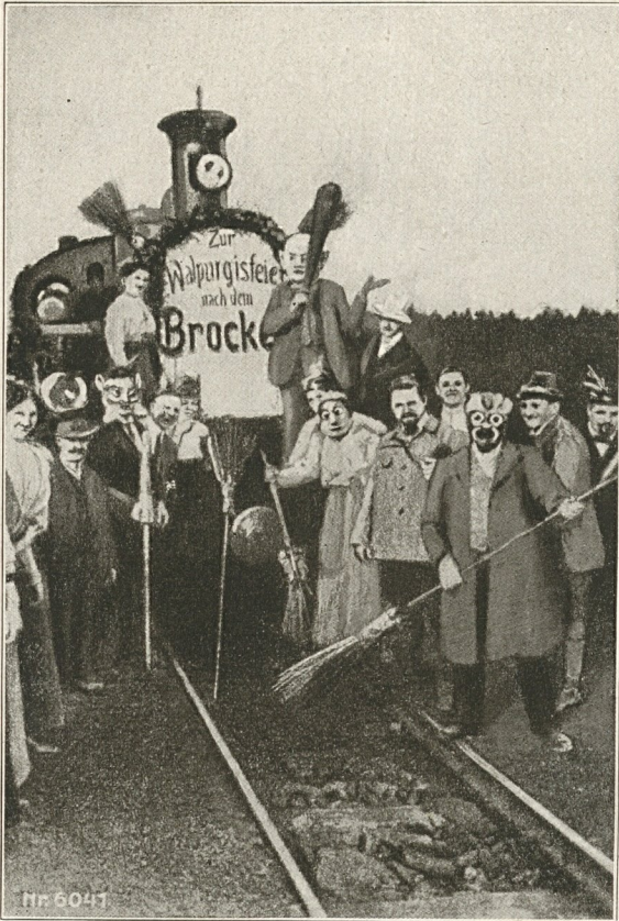
Abb. 111 Maskierte Teilnehmer an der Walpurgisfeier auf der Fahrt zum Brocken. „Wochenbild“, 6. Jahrgang 1920, Nr. 21.

glücks gar nicht mehr grauenhaft empfindet, sondern sich mit den im Vordergrund sitzenden Personen freut, daß sie ihre geliebte Manolischachtel gerettet haben. Abb. 111 zeigt uns eine übermütig geschmückte Lokomotive der Brockenbahn. Alljährlich findet auf dem Brocken eine Walpurgisfeier statt. Am 30. April, mitternachts 12 Uhr, wird vor dem Brockenhotel von einer lustigen maskierten Gesellschaft der Winter verbrannt und mit großen Reisigbesen ausgekehrt, so daß am 1. Mai der Frühling auf dem Brocken seinen Einzug halten kann.