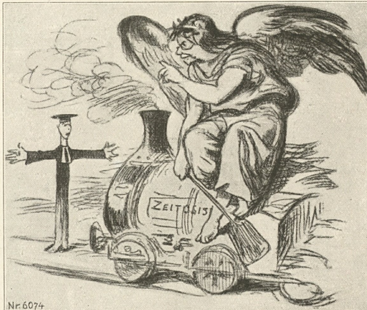
Abb. 34 Der Zeitgeist. 6074 (Wiener „Figaro“ 1886)