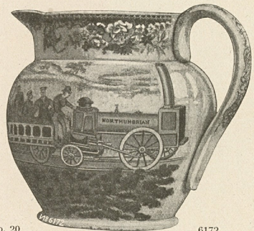
Abb. 20 6172

Sehr interessant ist auch die in Abbildung 20 gezeigte Malerei eines ganzen Zuges auf der Rundung eines Milchtropfes. Unser Bild zeigt nur den Anfang des Zuges, die Lokomotive Northumbrian bei der Eröffnung der Liverpool/Manchester-Eisenbahn.