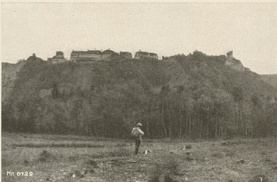
Abb. 18 Die „Eisenbahn“ auf dem Rauhberge bei Dahn (Pfälzer Felsenland). 6129

Rauchwagen u. haben diesen Namen dann auf die ganze Eisenbahn übertragen (nach Oberst Dr. Nigmann, Ostafrik. Skizzen). Sehr anziehend ist die nachfolgende Schilderung aus einem Briefe über Nordamerika: