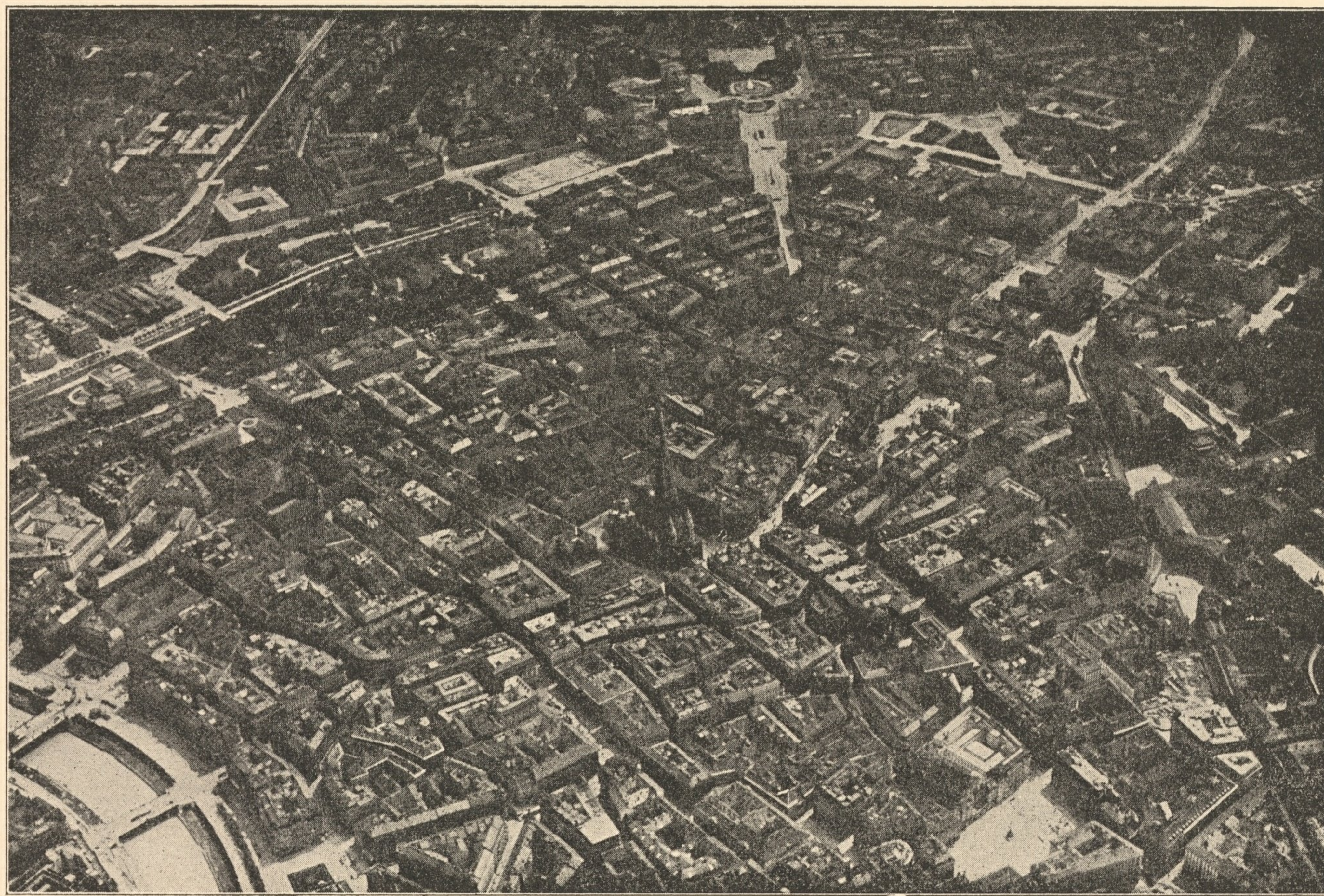
Vogelschau der Altstadt von Wien (I. Bezirk) im Jahre 1918.

Der vorliegende Plan gibt das Gegenteilbild der Stadt Wien im Grundriß und dient vor allem zum Vergleichsblatt für die vorausgehenden historischen Gesamtaufnahmen; er wird ergänzt durch die rechte Hälfte unserer Tafel I, welche das oberirdische Bodenbild und das unterirdische Kanalnetz des gegenwärtigen Wiener Siedlungsgebietes darstellt.