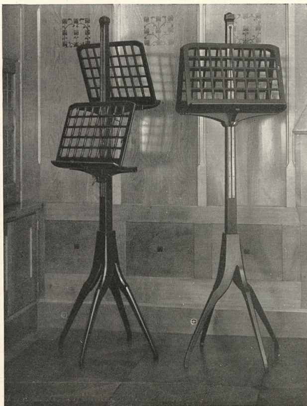
RICH. RIEMERSCHMID—MÜNCHEN. VERSTELLBARE DOPPEL-PULTE.