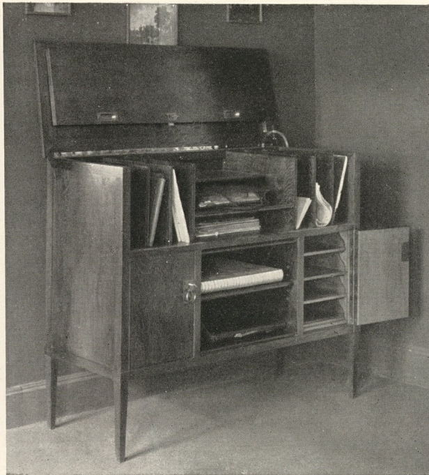
ENTWURF: ARCHITEKT PAUL WÜRZLER-KLOPSCH. SCHREIB-SCHRANK UND NOTEN-SCHRANK. AUSFÜHRUNG: CARL MÜLLER & CO.—LEIPZIG.