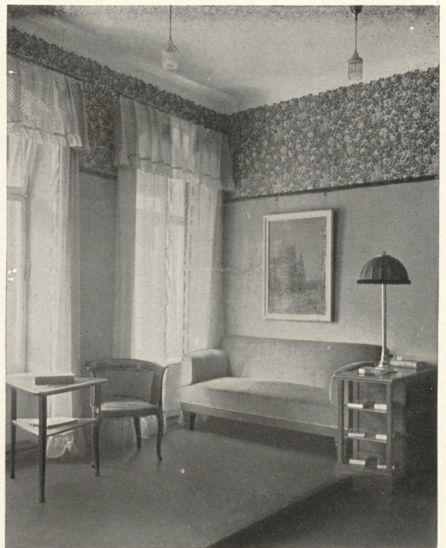
WARTEZIMMER IM HAUSE EINES ARZTES.