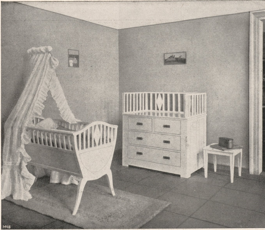
PROFESSOR BRUNO PAUL—BERLIN. KINDER-SCHLAFZIMMER.