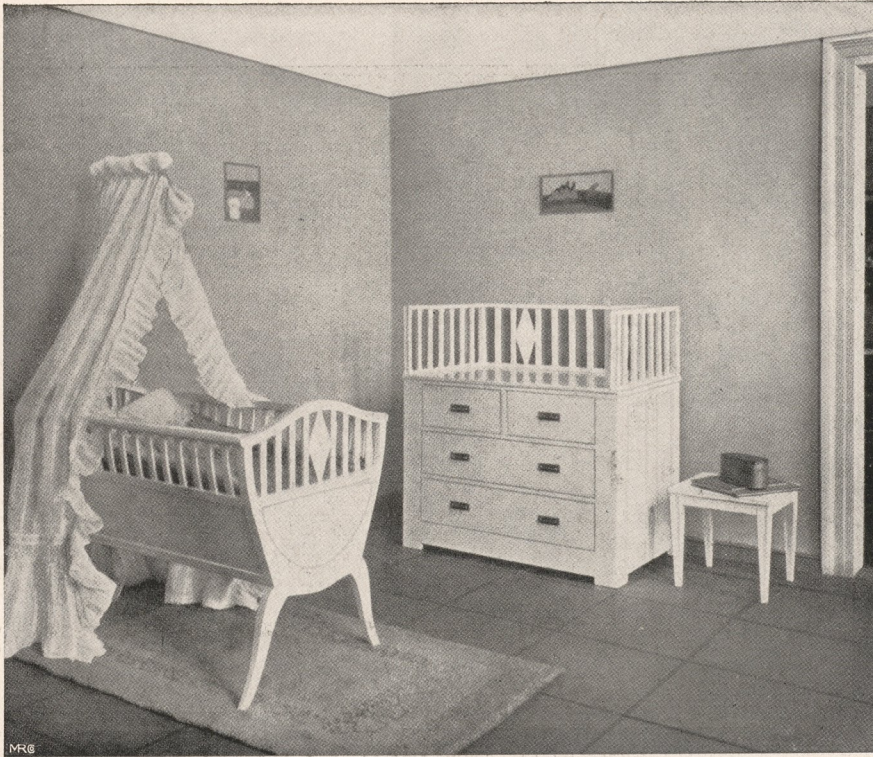
PROFESSOR BRUNO PAUL—BERLIN. KINDER-SCHLAFZIMMER.