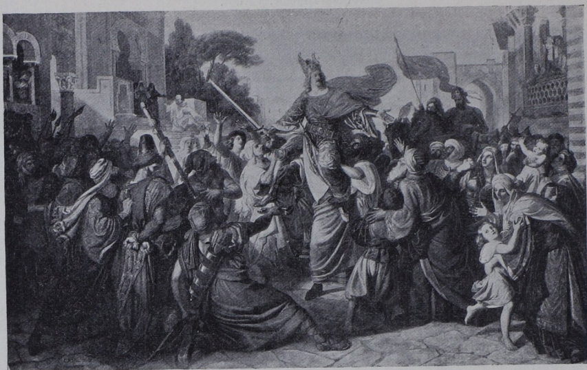
Abb. 149. Karl Rahl: Der Empfang Manfreds in Luceria (1254). Original in der kaiserl. Gemäldegalerie in Wien.