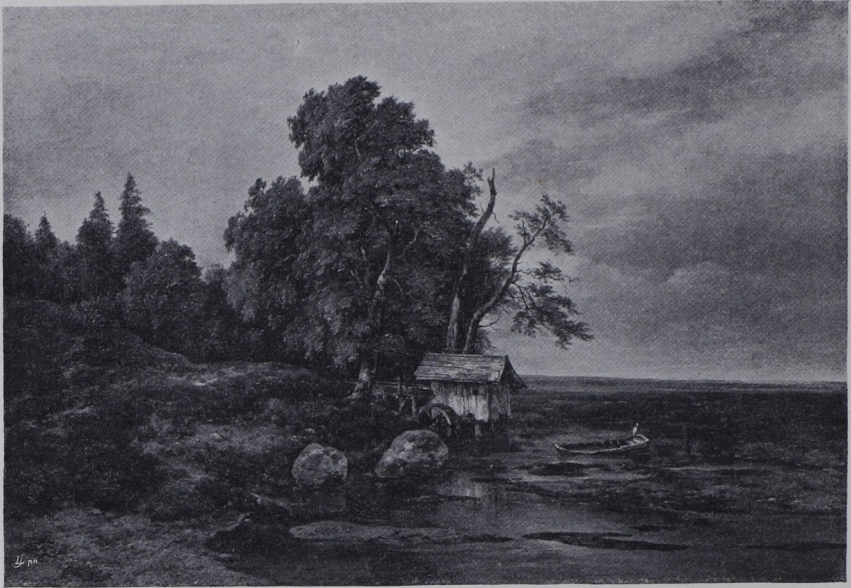
Abb. 69. Franz Steinfeld: Die verlassene Mühle. Original in der kaiserl. Gemäldegalerie in Wien.