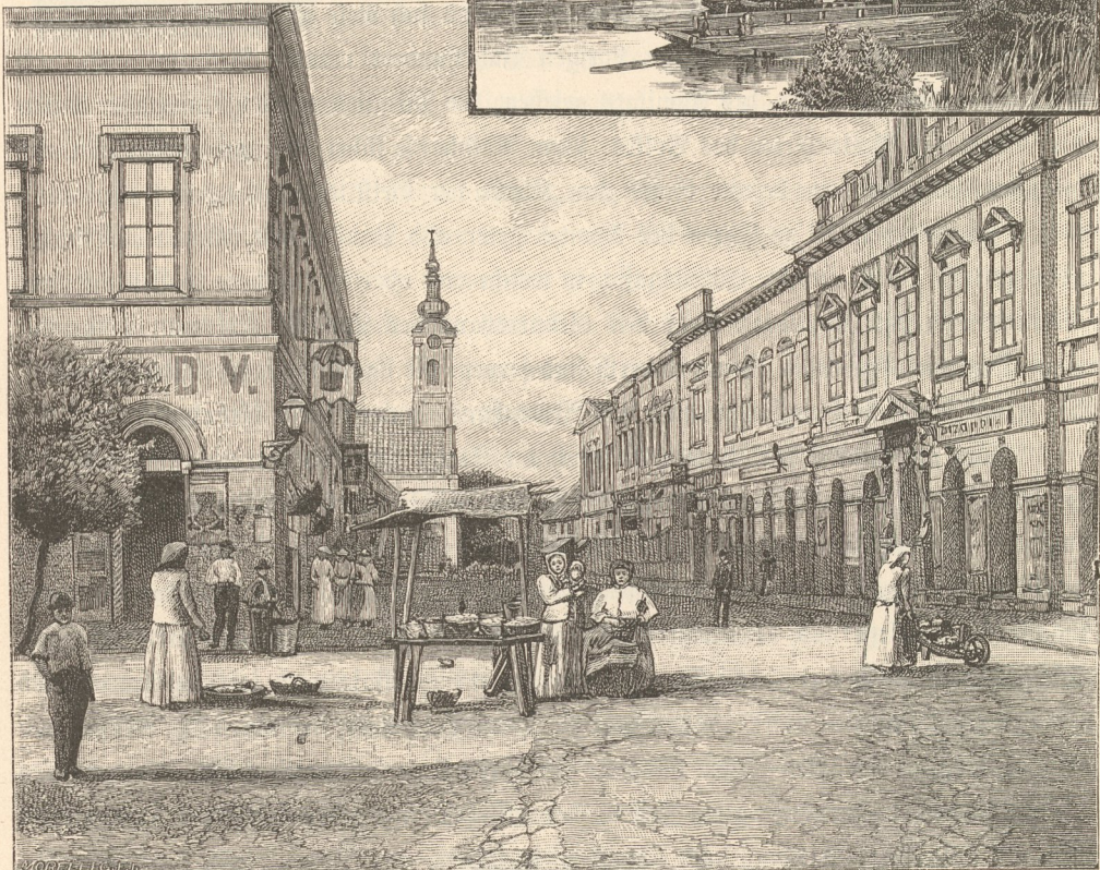
Hauptstraße in Baja.