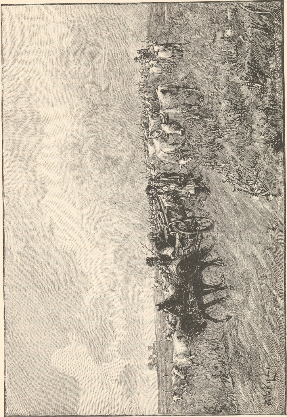
Begründung eines Gutshofs auf der Pruska.