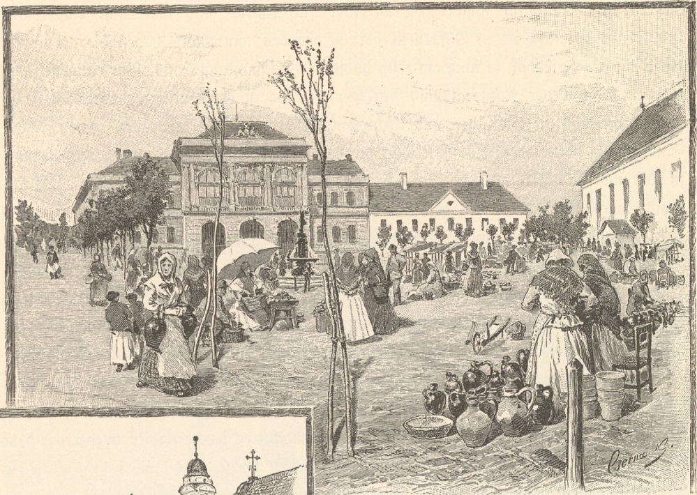
Hauptplatz zu Szentes.