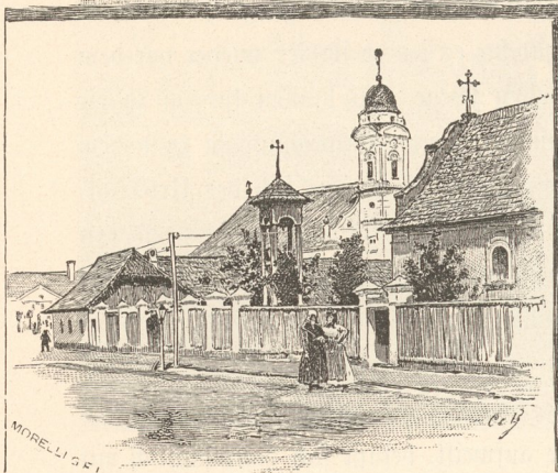
Reformirte und griechisch-orientalische Kirche zu Szentes.