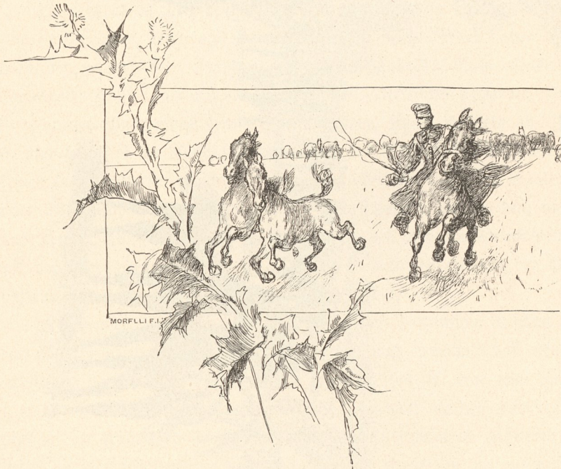
Vom Gefütt verirrte Fohlen.

Mezőhegyes übt als Musterwirthschaft einen weithin fühlbaren Einfluß aus; es wird auch fortwährend sehr stark von in- und ausländischen Landwirthen besucht, denn sein Ruf ist längst in die Fachreise der weiten Welt gedrungen.