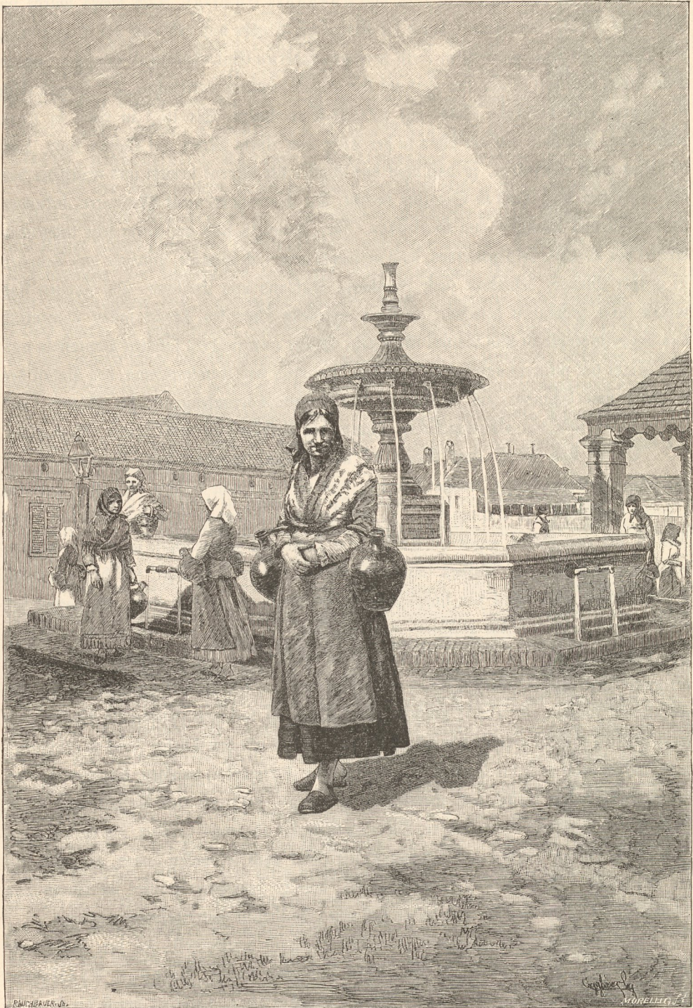
Artifischer Brunnen in Hód-Mező-Bárhely.