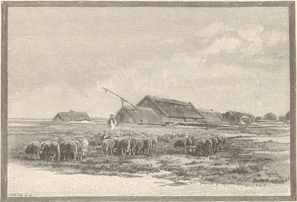
Schäferei im Gebiete von Hód-Mező-Bárányhegy.

Szegvár, welches längere Zeit der Comitatssitz von Csongrád war. Gegenüber von Mindszent erstreckt sich nach Westen eine der ausgebreitetsten Domänen Ungarns, das mehrere Quadratmeilen große Besitztum der Markgrafen Pallavicini. Die Gegend ist überhaupt die Heimat der besonders gut verwalteten Großgrundbesitze von echt ungarischem Typus. Östlich von Mindszent erstreckt sich in einem Strich die gleichfalls mehrere Quadratmeilen große Herrschaft von Derekegyhár und Mágocs. Beide Latifundien, als Musterwirthschaften vom Alföldler Typus bekannt, befinden sich im Besitze des Grafen