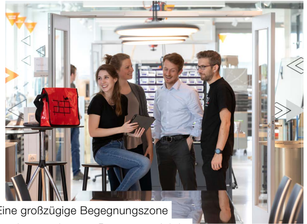
Eine großzügige Begegnungszone macht gemeinsame Pausen produktiv.