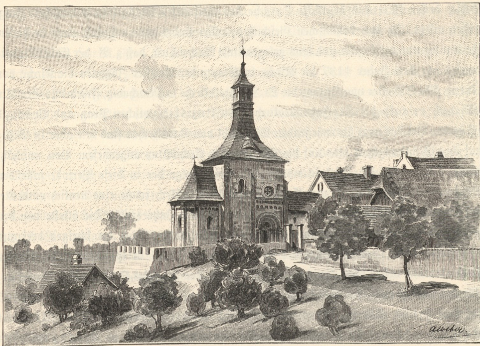
Die St. Nikolauskapelle in Binec bei Jungbunzlau.

in gleicher Weise hier wie dort. Die Grundrißbildung der dreischiffigen Basiliken war in ganz einfacher Art angelegt worden. Schmucklose quadratische Pfeiler theilten das Gebäude in zwei niedrige, mit einfachen Kreuzgewölben überspannte Seitenschiffe und ein mit einer flachen Decke versehenes Hochschiff mit einer gegen Osten gelegenen Krypta, deren halbkreisförmiger Schluß als Apsis emporstieg. In der Regel waren auch die beiden Seitenschiffe durch kleinere Apsiden geschlossen. Die St. Veitsbasilica wurde dagegen als Kathedrale durch eine zweithürige Anlage ausgezeichnet. Einige von den