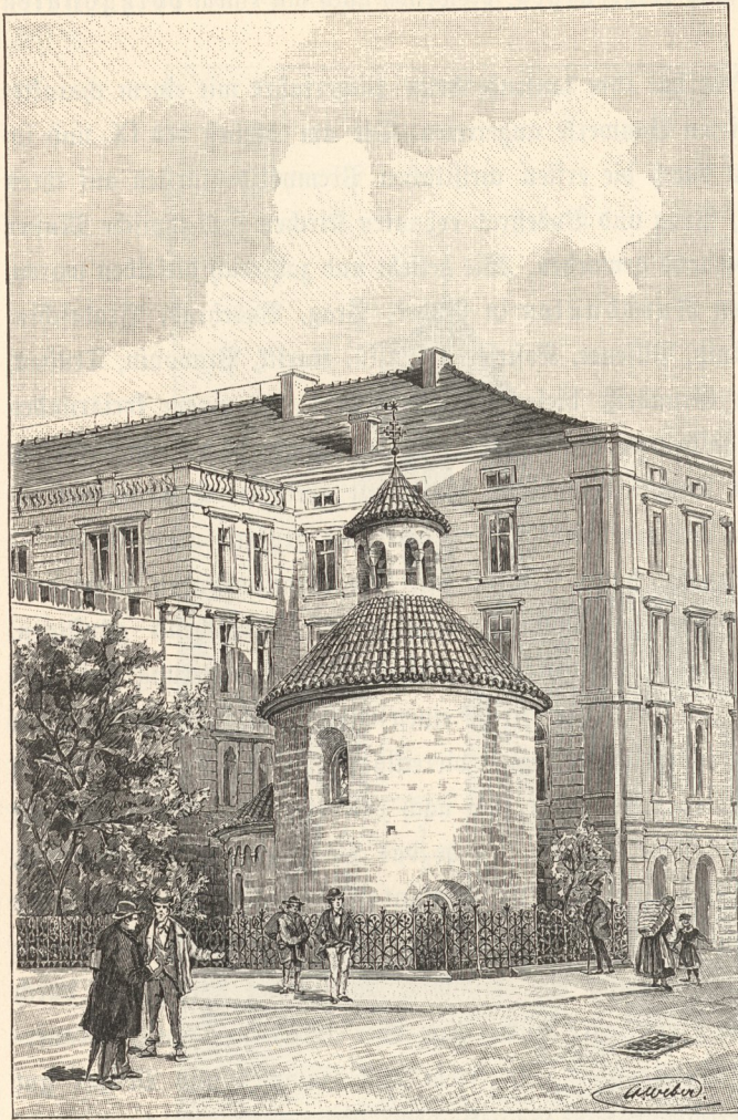
Die Notunde in der Postgasse zu Prag.

dieser auf seiner Burg Oldříš, und Břetislav I. erbaute zum Dank für den über Heinrich III. im Jahre 1040 errungenen Sieg gleichfalls eine Botivkirche, als welche die St. Wenzelskirche bei Brodek im Böhmerwald gilt. — Endlich werden neben Burg-