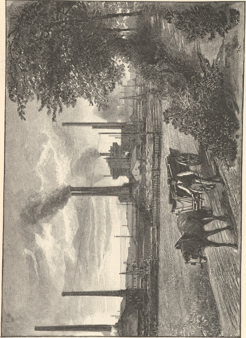
Partie vom erzhertzoglichen Eisenwerk: „Kaiser Franz Joseph-Gütte“ zu Trzpienc nächst Teschen.