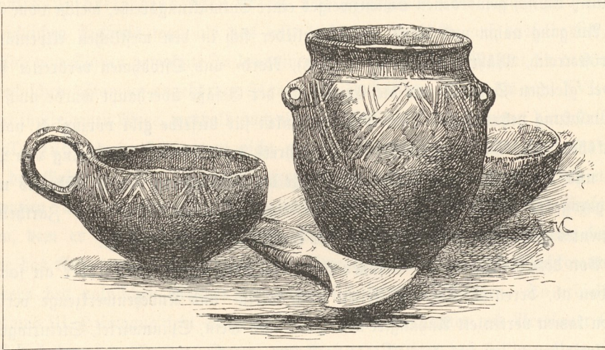
Funde von Groß-Elgoth.

Mit der Aufnahme des Eisens, das in Schlesien frühzeitig eine selbständige Erzeugungstätte fand, betritt unser Land die Hallstattperiode, jenes wichtige Culturstadium, das sich durch das allgemeine Bekanntwerden des Eisens charakterisirt und seine höchste Ausbildung in den Ländern südlich der Donau erfuhr. An Kostbarkeit der Bronze gleich geachtet, wurde neben derselben das Eisen zu Beginn dieser Culturperiode oft auch zu Schmuckgegenständen verarbeitet. So fand es sich in Gestalt zweier Kopfnadeln mit einem Ohrring, einer Fingerspirale und den Bruchstücken eines gedrehten, sowie