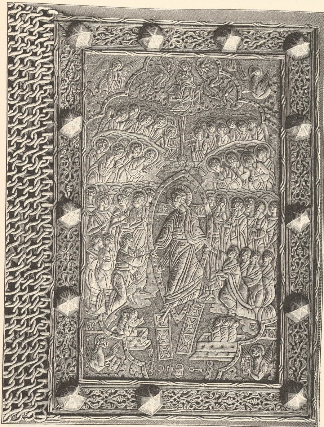
Teil eines silbernen Einbandes eines Evangeliums aus dem Kloster Dragomirna (circa 1612).