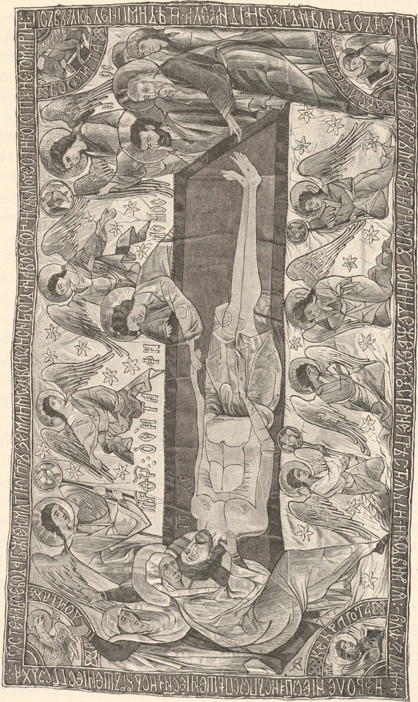
Heilige Grabbette (Aer) aus dem Kloster Putna (1490) mit der Grabbelegung Christi.