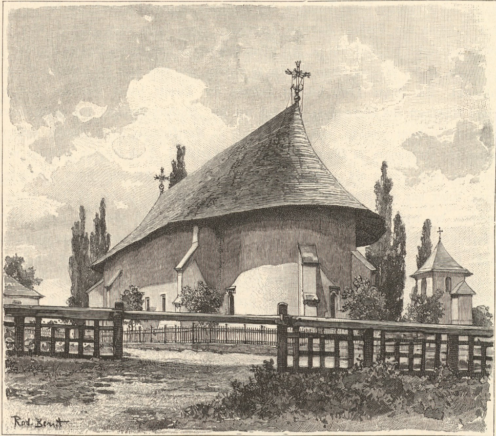
Die griechisch-orientalische Kirche zu Radauz.

mit den Besitzungen Bogdans in Marmarosz belehnt, erwähnt ihn ohne die übliche Bezeichnung, daß er bereits todt sei; vielmehr weist die Aussage, daß diese Besitzungen „von dem ungetreuen Bogdan und seinen Söhnen genommen“ und Balk verliehen werden, darauf hin, daß Bogdan noch am Leben war. Darnach ist die Angabe der moldauischen Chroniken über die Regierungsdauer Bogdans auf 16 Regierungsjahre zu berichtigen, was mit den Angaben über die Regierungsdauer der anderen Fürsten übereinstimmt.