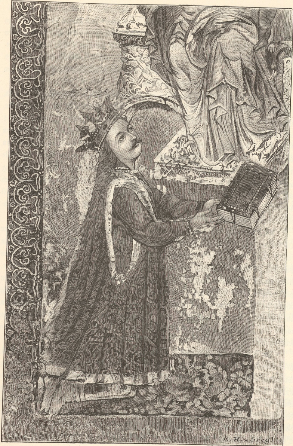
Stefan III. der Große, moldauischer Fürst (1457–1504).