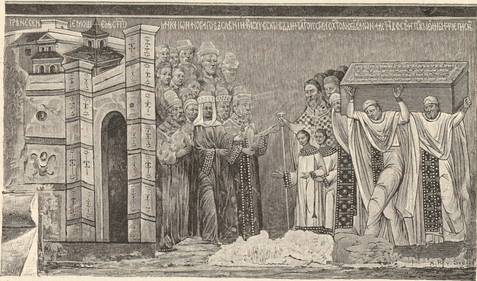
Die Überführung der Reliquien des heiligen Johannes Nobi nach Suczawa.

Laško eingeführten Katholicismus aufzufassen sein. Und in der That schreibt ihm die moldauische Chronik des Ureche die Errichtung der griechisch-orthodoxen Metropole der Moldau zu, die er dem Patriarchate von Ochrida unterstellte. So glaubte Georg seine Stellung festigen zu können. Trotzdem vermochte er sich nicht zu behaupten und mußte schon nach einem Jahre dem Sohne Costeas, Peter Muşat, den Platz räumen. Die moldauischen Chroniken, die ihn Tuga nennen (er selbst nennt sich in der erwähnten Urkunde „Turg Korijatovič“), geben ihm zwei Regierungsjahre als unmittelbarem Vorgänger Alexanders des Guten, der 1400 zur Regierung kam. Thatsächlich hat Georg Koriatowicz im Jahre 1400 die Herrschaft in der Moldau zum zweitenmale an sich gebracht, welche