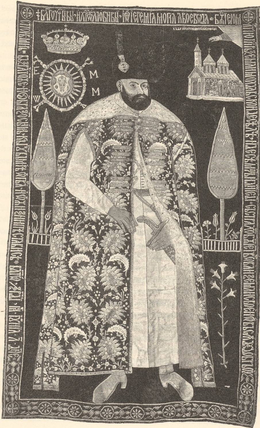
Jeremias Moghila, moskauischer Fürst; nach der gestickten Grabbede im Kloster Suczawka.