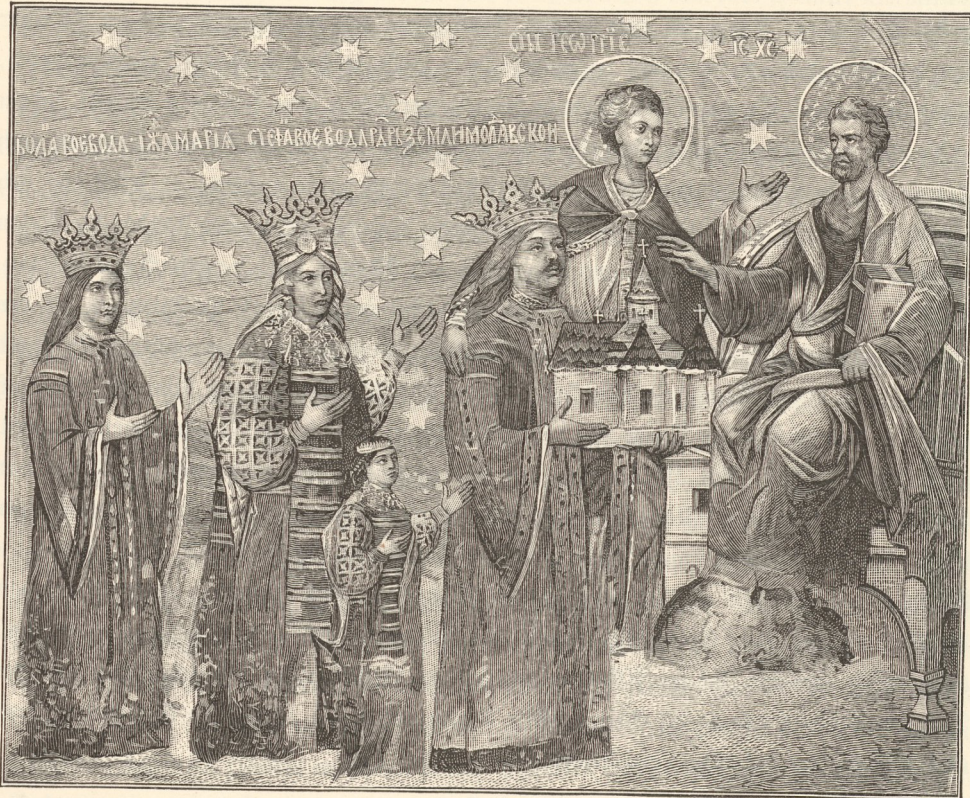
Stiftung der Voronezer Klosterkirche durch den Fürsten Stefan III.

außerordentliche Vollmachten in Siebenbürgen und forderte am 11. August 1490 die siebenbürgischen Stände auf, dem moldauischen Wojwoden Stefan, der in des Königs (Maximilian) Namen ihre Huldigung entgegenzunehmen und sie zu schützen beauftragt sei, Gehorsam zu leisten. In diese Zeit, da Stefan gegen den jagellonischen König von Ungarn und Böhmen auftrat, gehört wohl der Einfall ungarischer Truppen unter Hromot (ein Name mit böhmischem Klang) in die Moldau, den die moldauischen Annalen