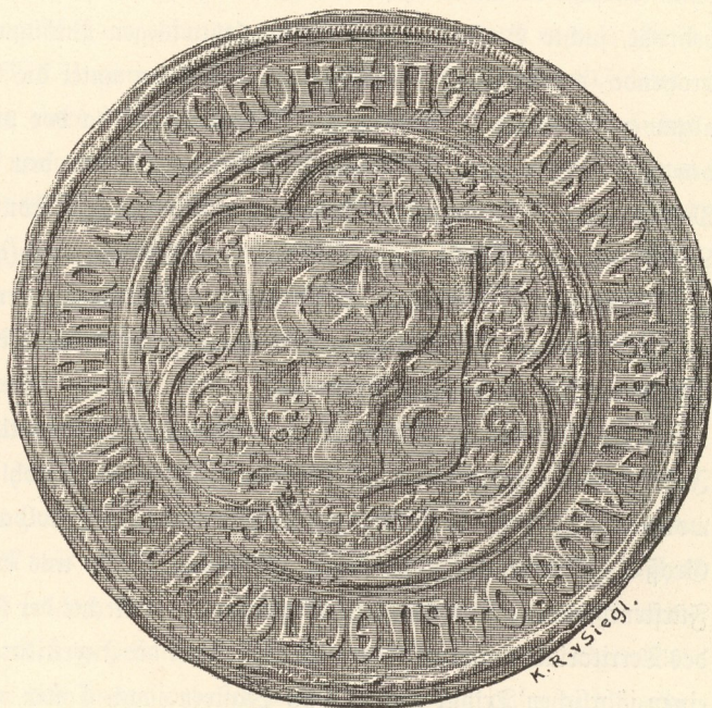
Siegel des moldauischen Fürsten Stefan IV.