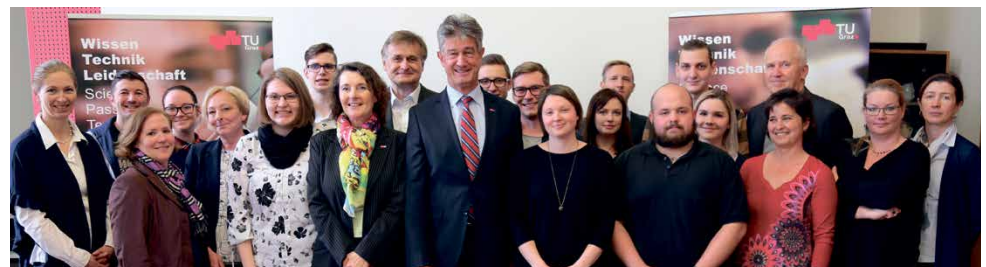
Lehrabschlussfeier an der TU Graz.

Der Technicknachwuchs wächst stetig an der TU Graz. Derzeit lernen 40 junge Damen und Herren einen Lehrberuf an unserer Universität, diesen Februar wurden elf weitere Lehrstellen für Herbst 2019 ausgeschrieben. Das Lehrangebot ist breit gefächert, dreizehn verschiedene Lehrberufe können derzeit an der TU Graz erlernt werden.