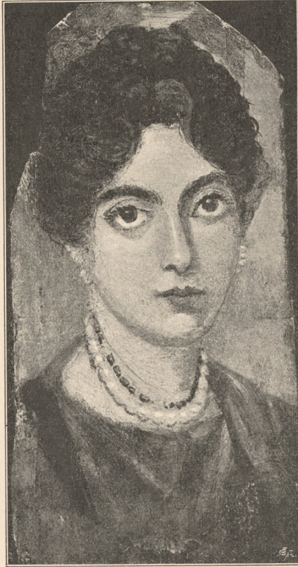
Fig. 3. Enkaustische Malerei aus El Faijum (Sammlung Th. Graf in Wien).

Zu Plinius' Zeit erfand man aber eine wesentliche Verbesserung dieser Technik. Er selbst sagt: »... bis man an-