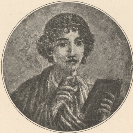
Fig. 5. Sappho, Frescogemälde aus Pompeji (Museum Neapel).

Stücke (siehe Fig. 4, Zeichnung auf einer Marmortafel) zeigen, dass es auch eine Kunst auf hoher Stufe gab. In den leider noch immer nicht publicirten Gräbern von Corneto, in welchen kleinlicher Gelehrtenneid die Besichtigung kaum und das Copiren gänzlich verbietet, sah der Autor etruskische Gemälde von solchem Liebreiz, wie sie nur oben erwähnte Marmortafel ahnen lässt. Die Farbe guter Tafelbilder wird uns erst aus den gut erhaltenen feineren Mosaikbildern vor Augen geführt, welche auch eine Art Tafelgemälde gewesen zu sein scheinen. Da gibt es einige aus Pompeji im Museum in Neapel — von der Alexanderschlacht abgesehen —, welche den ganzen Farbreiz eines fein gestimmten Gemäldes haben. Ja selbst einige der Wandgemälde weisen auf gute Vorbilder hin, wie das schöne Gemälde: »Chiron lehrt dem jugendlichen Achilles das Saitenspiel«, ein »weinender Amor« oder die »Sappho«. (Fig. 5.)