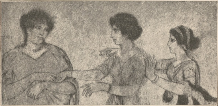
Fig. 4. Die Knöchelspielerinnen, Herculenum (Museum Neapel).

bei Köpfen im Profil die aufgeschlagenen und gesenkten Augen zu malen verstand. Polygnotes, der Erste der grossen Maler (455 v. Chr.), bedeckte bereits öffentliche Gebäude mit Wandgemälden geschichtlichen Inhalts. Er strebte schon nach Naturwahrheit und Porträtähnlichkeit. Er soll die Fische des Acheron, des Todtenflusses, schattenartig gemalt haben und die Kiesel durch das Wasser haben durchscheinen lassen. Der nächste Fortschritt war, dass Apollodoros gemalte Hintergründe in der Tafelmalerei einführte und den Figuren Licht und Schatten gab. Zeuxis malte Trauben, welche die Vögel