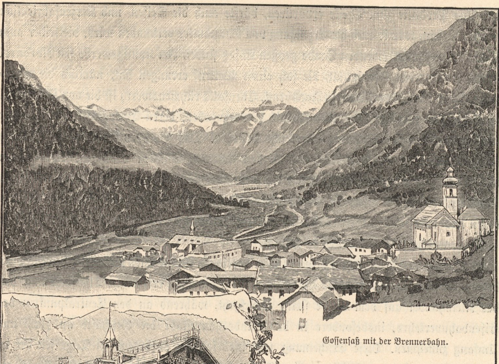
Gossensaß mit der Brennerbahn.