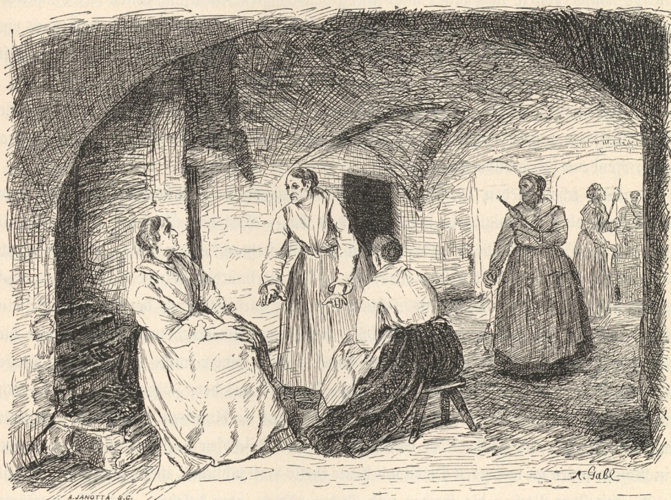
Weiber aus Rendena, wie sie im Filò (Vorraum des Stalles) spinnen und Märchen erzählen.

Nun wolle mich der geneigte Leser auch auf einem Gang in das Reich der Sage begleiten.