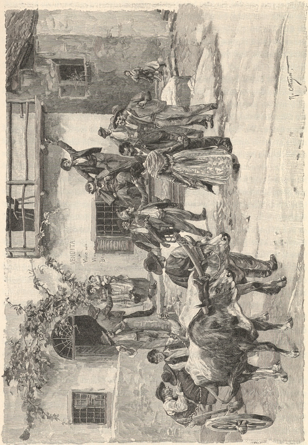
hochzeitstrauch; Die Roschia.