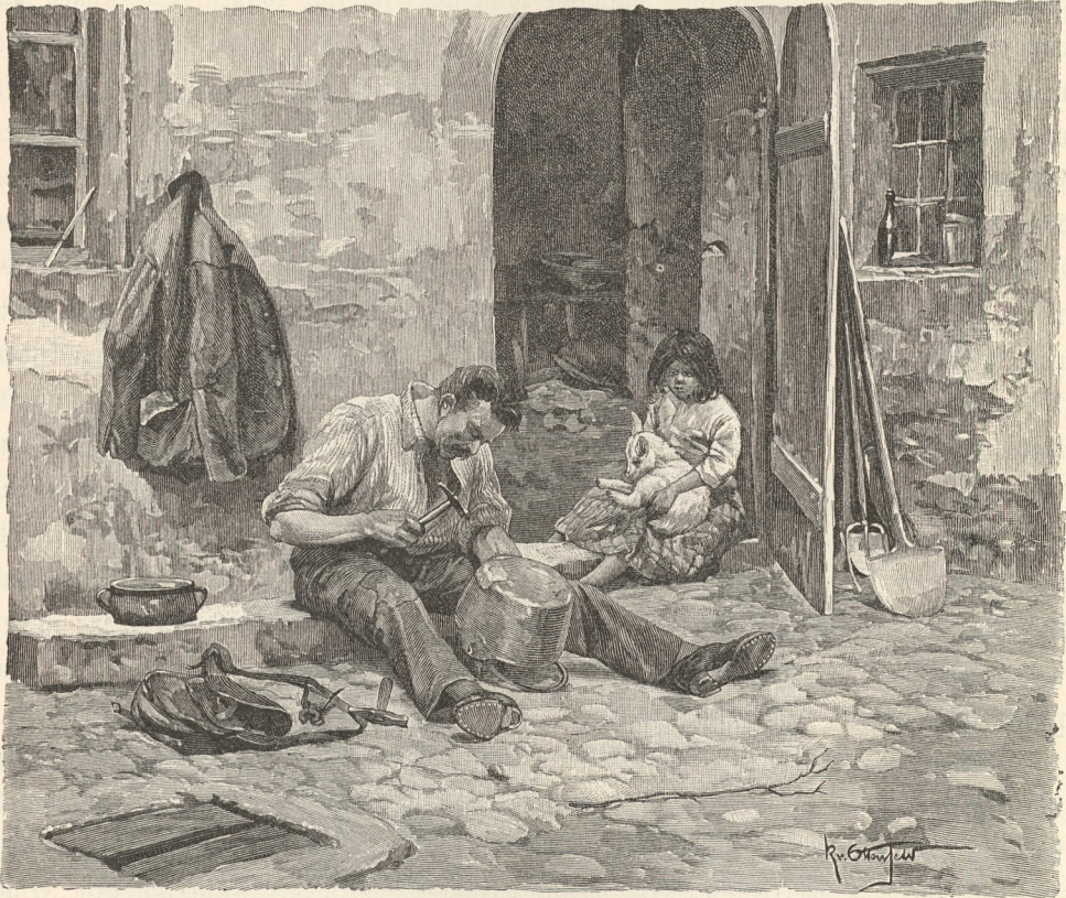
Parolot (Kesselflicker) aus Val di Sole.

vielen Jahren einmal im Winter ein Mann dort vorüberkam, erblickte er mitten im Schnee am Ufer des Sees einen grünen und blühenden Ahorn, unter welchem die verklärte Leiche des frommen Büßers lag. Auf die Kunde davon eilte das Volk dorthin; man begrub ihn ehrenvoll und erbaute dort eine Kapelle. Diese, später wohl öfter umgebaut, steht noch dort, in ihr die hölzerne Statue des Heiligen, welcher eine Schlange in der Hand hält.