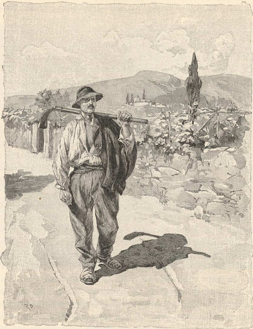
Segantino aus Jubicarien.

wasser ausschenkt, und der Salvanel, der ähnlich wie sonst der Drco, die Leute grausam narret und zum Besten hat. Dann beginnt das Reich der Hexen mit ominösen, aber nicht immer recht verständlichen Namen, wie Aga und ihre mit Zampadegal erzeugte Tochter