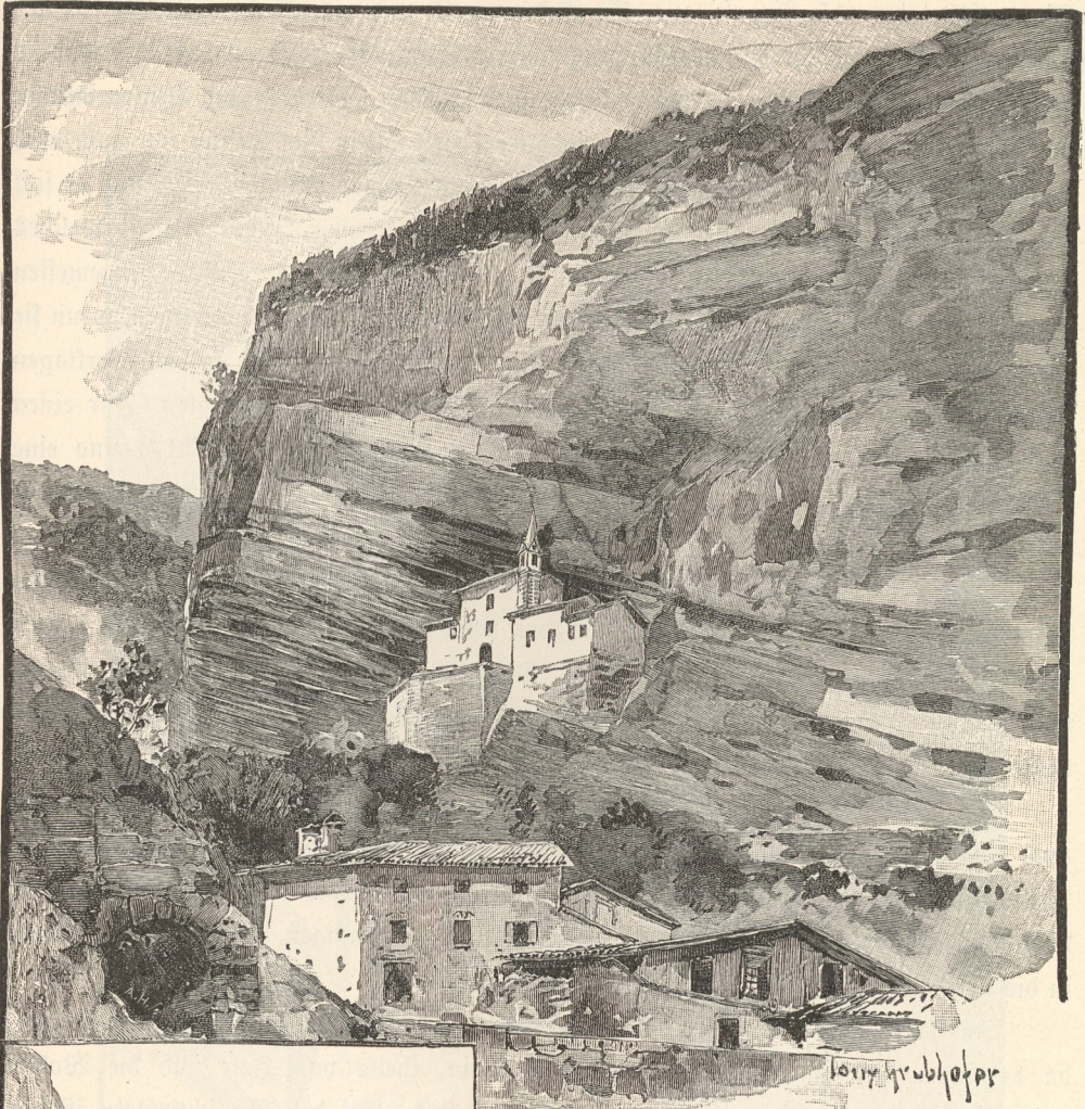
Ponte e Chiesa di S. Colombano in Ballarza.