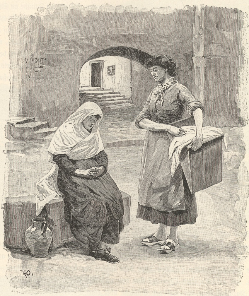
Weib in Trauer mit weißem Schleier und Wäscherin aus Mendena.

einem platten länglichen Fäßchen einer nach dem andern einen Schluck Wein nahmen, bis es leer war und wieder nachgefüllt werden mußte. Und wie dunkel sah er aus, der alte Parolot (Kefler) aus dem Mons- oder Sulzberg, und wo ist er hingefommen?