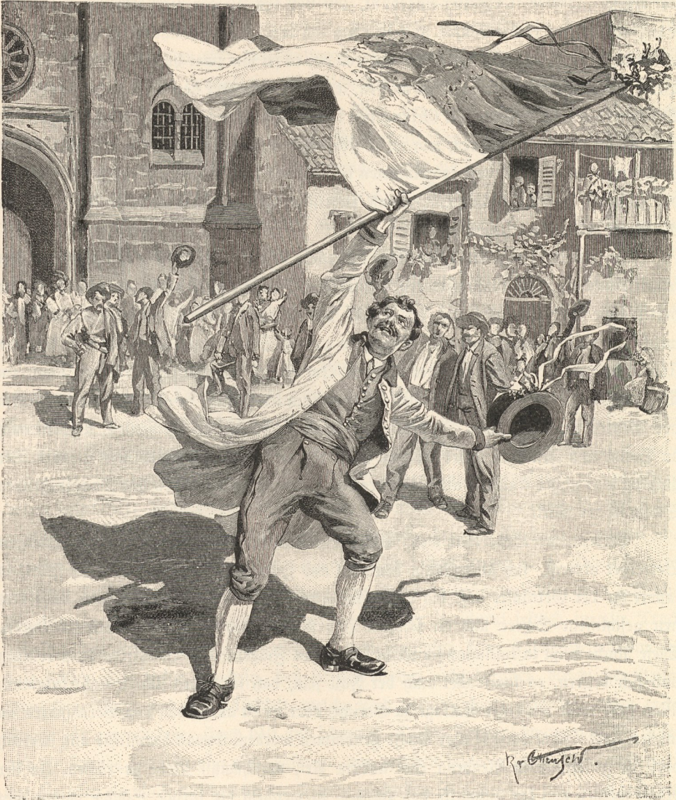
Das FahnenSchwingen im Heimsthal.

kostbares Juwel, eine Gioja, entführen wolle. Der Bräutigam hat seinen Vater oder einen guten Freund als Vertheidiger zur Seite, welcher nun alle Witze und Späße losläßt, um die Anklage zu entkräften. Nachdem er den Einwendungen des Anklägers gegenüber alle