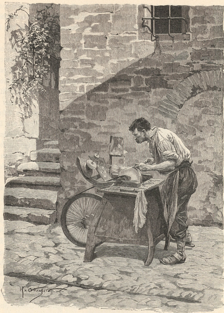
Moleta (Schleifer) aus Mendena.

rother Hautfarbe, welcher mitten in den Wäldern in Höhlen wohnt und zahlreich Herden besonders von fetten Schafen mit schöner Wolle besitzt. Er trinkt den Hirtenzern die Milch aus, während er die von seinen Herden zur Käsebereitung braucht. Eine Hirten, welcher ihn listig mit Wein berauscht und gefangen hatte, lehrte er Butter, Lab und Käse bereiten; hätte ihn der Hirte nicht vorzeitig frei gegeben, so hätte er auch noch Lernen