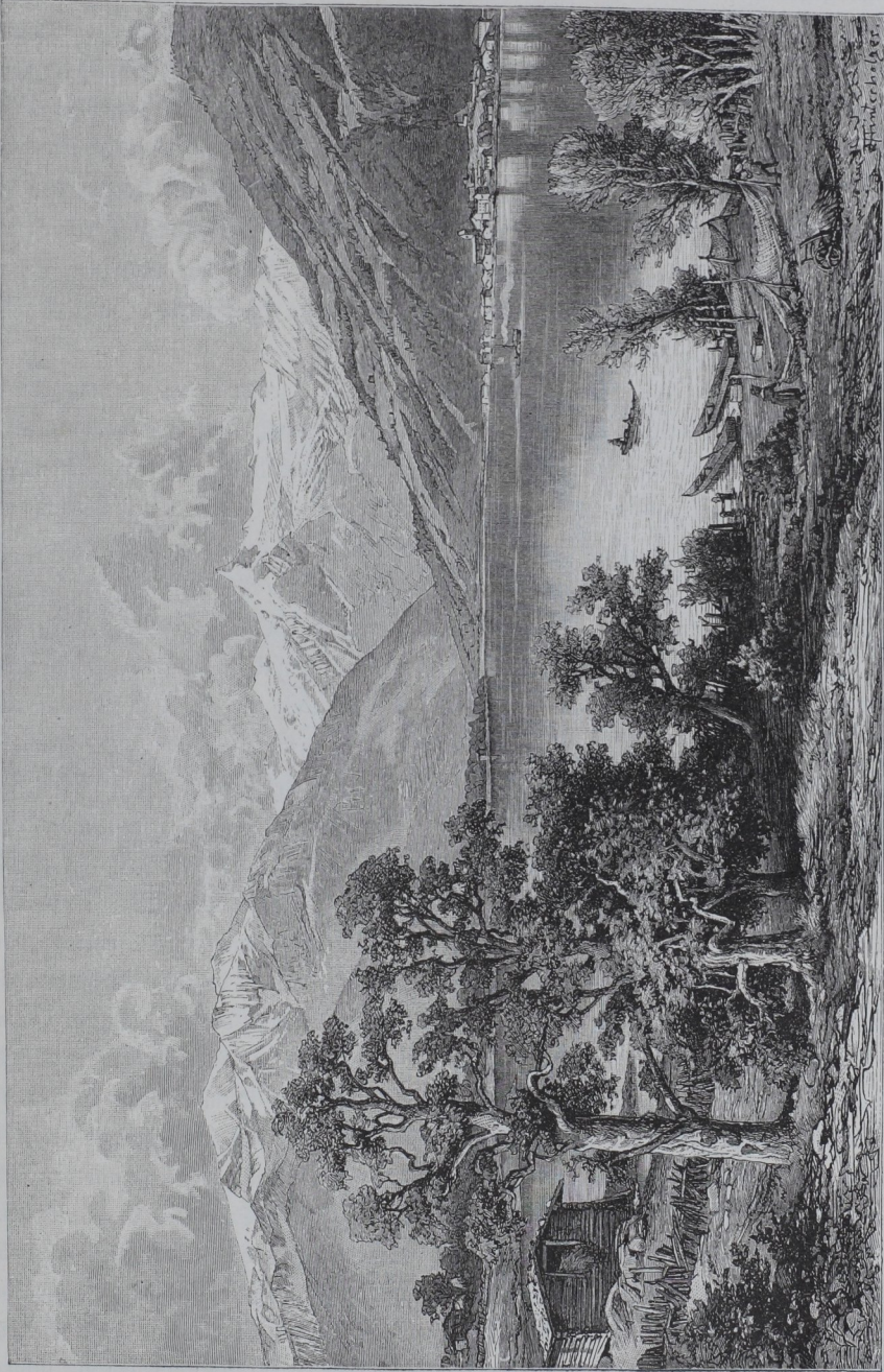
See am See.