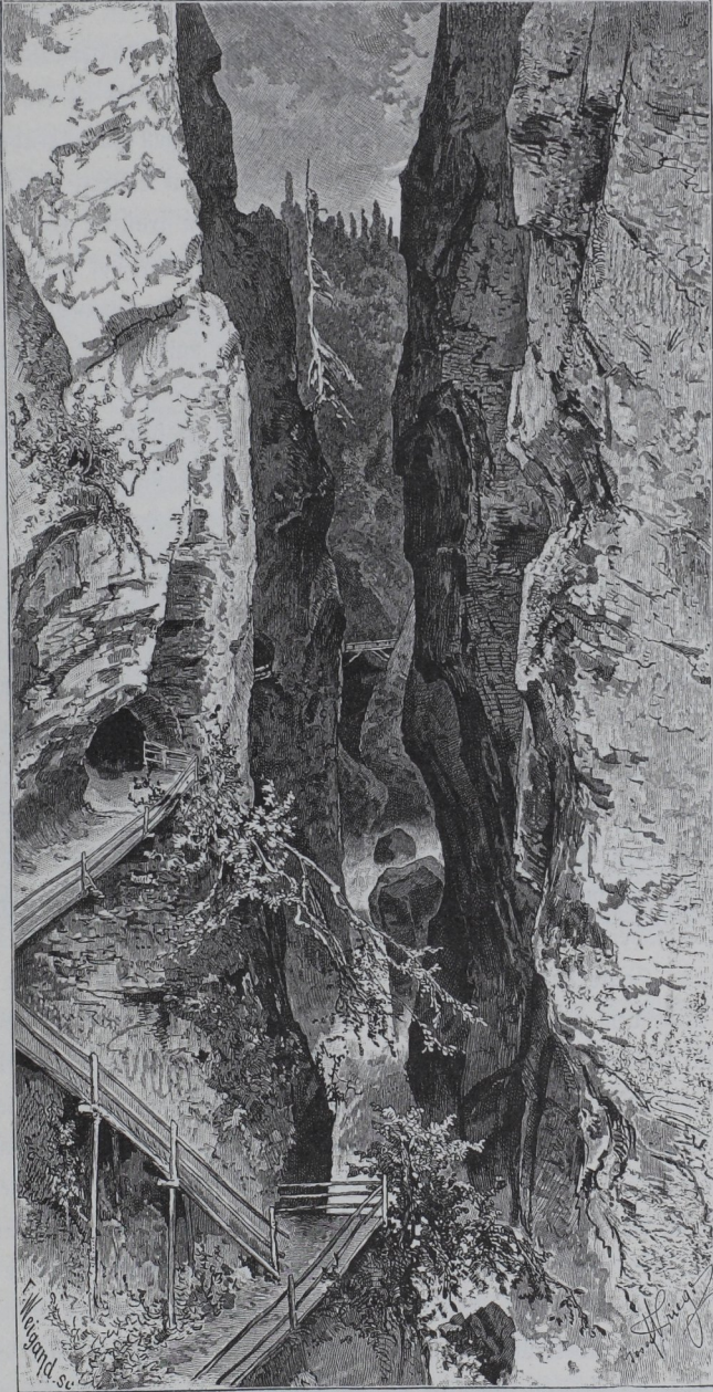
Die Felslochklamm bei Tengenbach.