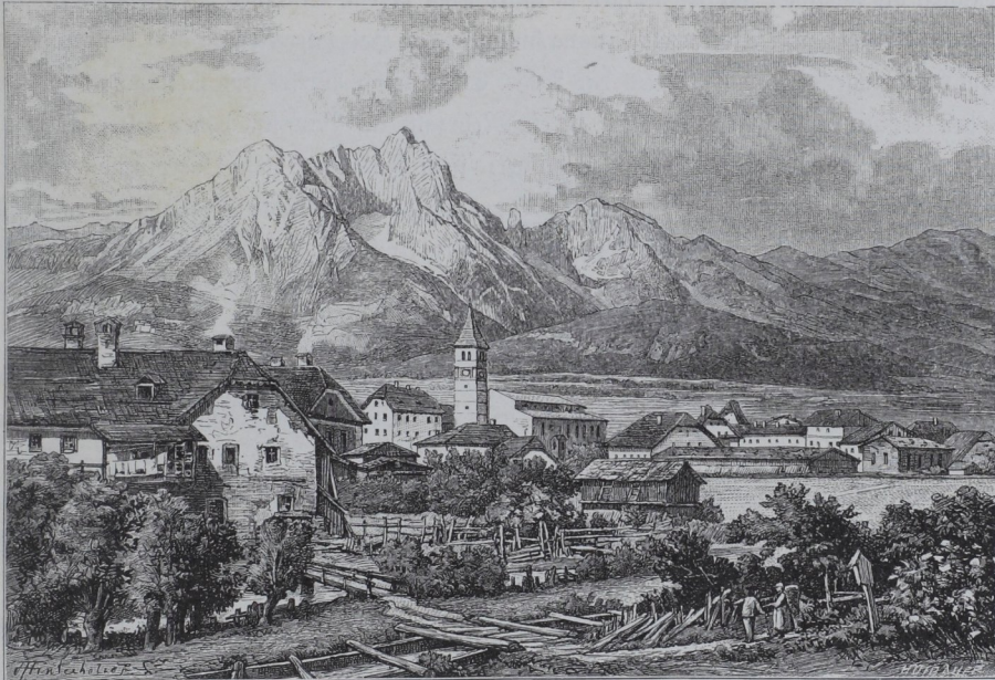
Saalfelden mit dem steinernen Meer.

Durch Lofer geht die alte Hauptstraße von Tirol, dessen Grenze westlich nahe beim Markt am Paß Strub, einem Kampfplatz in den Franzosenkriegen 1805 und 1809, liegt, nach Salzburg. Nach einer Enge am Knie-Paß gelangt sie in Unken wieder auf