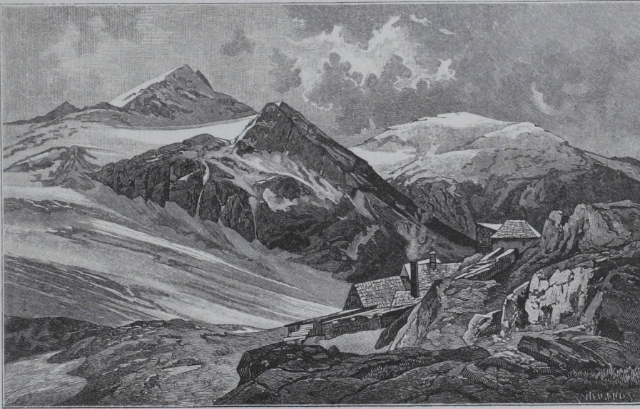
Das Knappenhäuser auf dem Goldberg bei Rauris.

Das Thal hat sich erweitert und die eisigen Höhen am Thalschlusse des Hüttwinkls sind sichtbar geworden. Rauris entspringt nämlich auf dem Centralkamm der hohen Tauern in zwei Thalästen, dem bis zur Mündung des Thales nördlich laufenden Hauptthal Hüttwinkl und dem Seidwinkl, welcher sich nach nordöstlichem Zuge eine Stunde südlich vom Markt Rauris bei Wörth mit dem ersten verbindet. Durch den Seidwinkl führt der