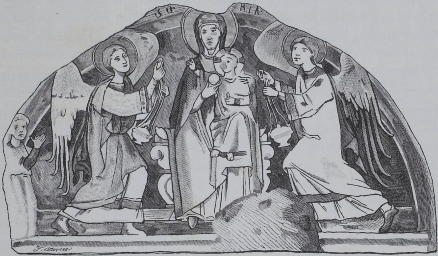
Madonna, Freskogemälde über dem Hauptthore der Liebfrauenkirche in Wiener-Neustadt.