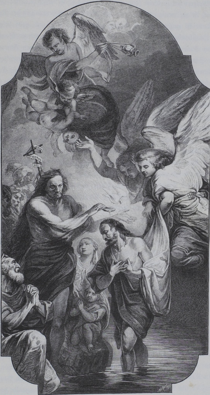
Die Taufe Christi, Altarbild von Josef Martin Schmid in der Pfarrkirche zu Stein an der Donau.