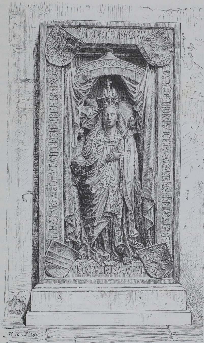
Das Grabmal der Kaiserin Eleonora in Wiener-Neustadt.