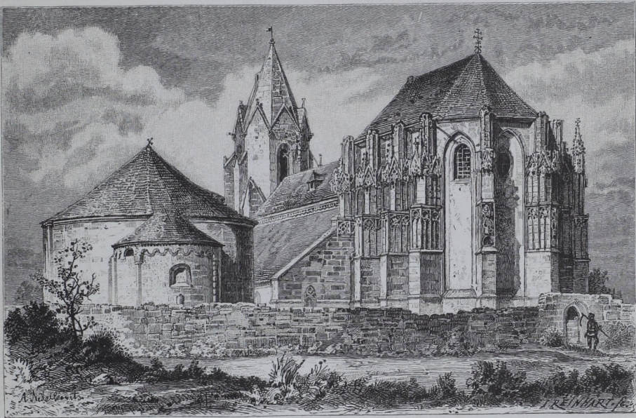
Die Pfarrkirche und Rundkapelle in Deutsch-Altenburg.

Als eine Besonderheit des romanischen Stiles, ebenfalls alle seine Wandlungen mitmachend, haben wir der in Niederösterreich heute noch in bedeutender Zahl vorkommenden Karner und Taufkapellen zu gedenken. Die ersteren charakterisiren sich durch die Anlage eines Beinhauses, einer Unterkirche, darüber die eigentliche Kapelle sich befindet, die letzteren entbehren dieses unteren Raumes und sind im Ganzen größer angelegt. Diese Kapellen beider Arten bestehen aus einem kreisrunden, in späteren Zeiten des romanischen Stiles aus einem polygonen Centralraum, an welchen sich ein halbrunder Ausbau für den Altar anschließt. Solche ursprünglich mit steinernen Kegeldächern versehene Rund-