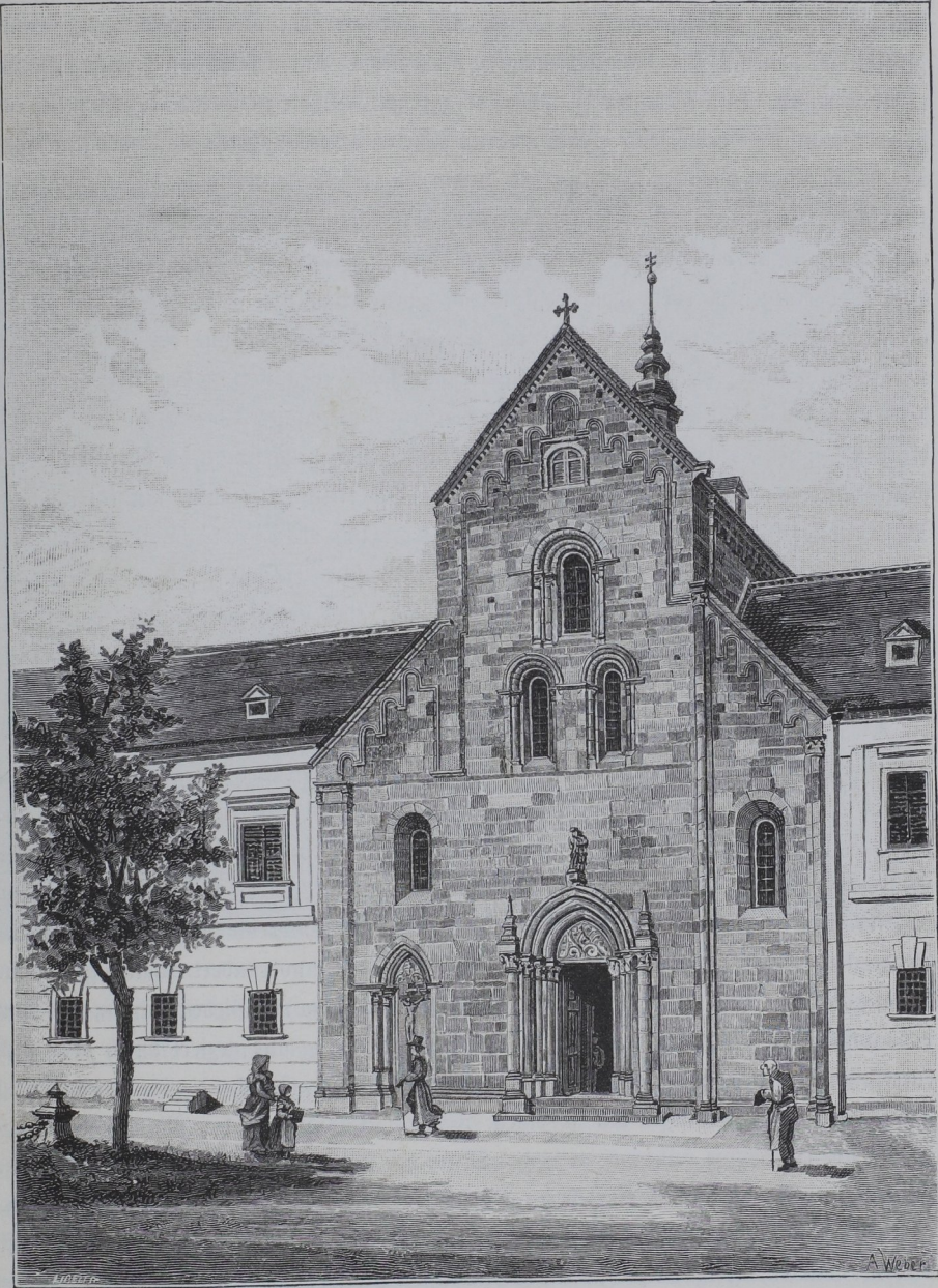
Die Stiftskirche von Heiligenkreuz.