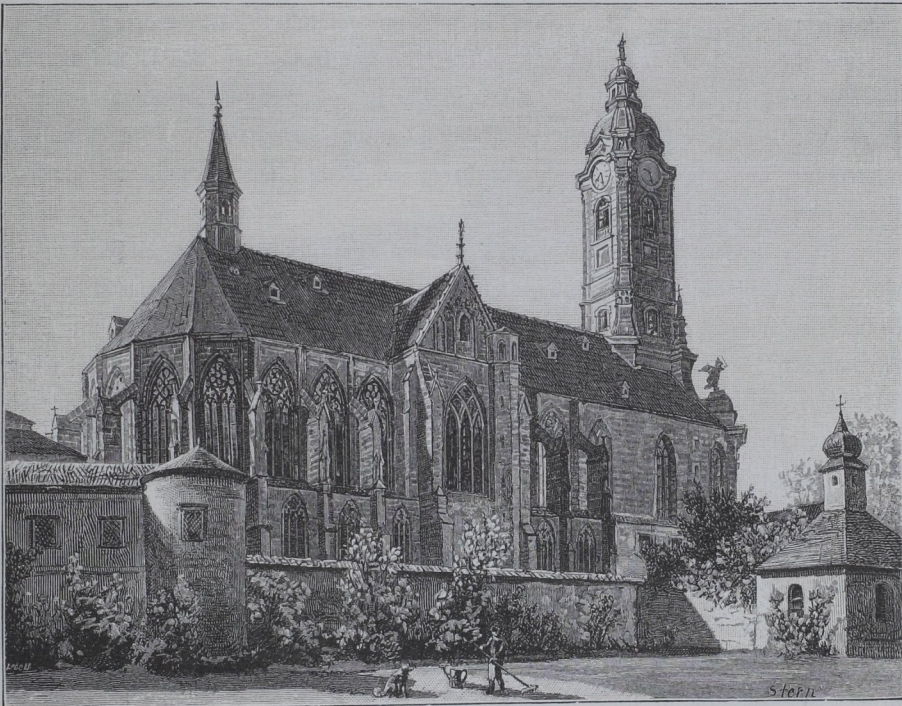
Die Stiftskirche in Zwettl.

Das XV. Jahrhundert zählt eine namhafte Reihe kirchlicher Bauten. Die zahlreichen Ansiedlungen, die sich bis dahin gebildet und in ihrem Bestande gesichert hatten, das Aufblühen der Städte, alles dies war der Errichtung von Kirchen sehr günstig, alte