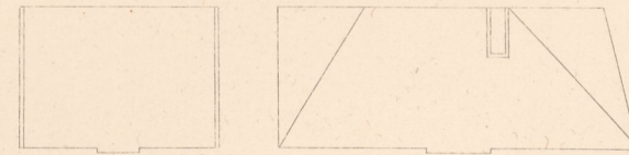
Grundriss des II ten Stockes.