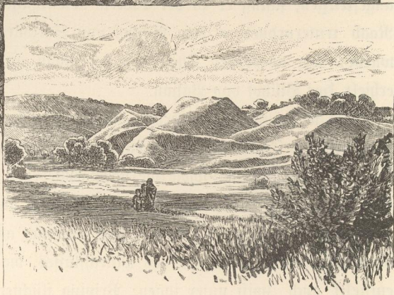
Wallbauten bei Kéménd.

wir nirgends in Europa, wo die Römer geherrscht hatten — ein deutlicher Beweis dafür, daß so plötzliche und durchgreifende ethnographische Wandlungen sich nirgends ereigneten wie hier. Der Ennsfluß bildete die westliche Grenze des Avarenreiches gegen Bajuwaren (Baiern), im Südwesten berührte es die Lombardei. Mit den Longobarden stand es wohl immer, mit den Baiern in der letzten Zeit in freundlichem Verhältnisse, was Karl den Großen gegen sie aufreizte. Dieser hatte schon 774 Pavia erobert und den letzten Longobardenkönig, Desiderius, in ein Kloster gesteckt. Dessen Tochter, Luitberga, stachelte ihren Gemal, den Baiernfürsten Thassilo, auf zum Rachekrieg gegen Karl. Thassilo erbat sich avarische Hilfe: aber Thassilo war kein Alboin und die Avaren hatten keinen Bajan, im Gegentheil finden wir sie in Parteien zerrissen. Trotzdem daß avarische Gesandte 782 bei Karl, der an der Lippe lagerte, um Frieden baten, zogen doch 788 zwei avarische Heere dem Thassilo zu Hilfe, den aber seine eigenen Baiern verließen. 790 suchte Karl die Grenzfrage zwischen Baiern und Avarien zu schlichten, und dies führte zum Kriege. 791 zog Karl selbst von dem Ennsflusse aus gegen die Avaren, die er überall besiegte, so daß er bis an den Ausfluß der Raab in die Donau vordrang. 795 setzte sein Sohn Pipin mit