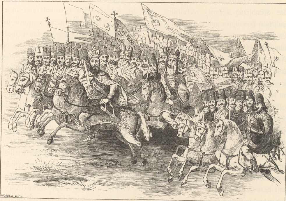
Serbische Krieger in der zweiten Schlacht auf dem Rigómezö (Rosjovo-Polje).

und Siebenbürger Waldböden bevölkert und ertragfähig gemacht. In den Karpathen waren die neuen Ansiedler Slaven, meistens Russinen (Ruthenen), in Siebenbürgen aber aus Bulgarien herüberkommende Hirten, zumeist Walachen. Diese Walachen betrachtete die Krone im Anfang als ihre Leute; sie lieferten ihr jedes fünfzigste Stück Schaf, — das war die Quinquagesima (das Fünfzigstel) oder die Walachensteuer bis in das XVI. Jahrhundert. Und als die Krone auch Privaten erlaubte, in ihren Wäldern Walachen anzusiedeln, so verlangte und erhielt sie auch von diesen die Quinquagesima. Bereits