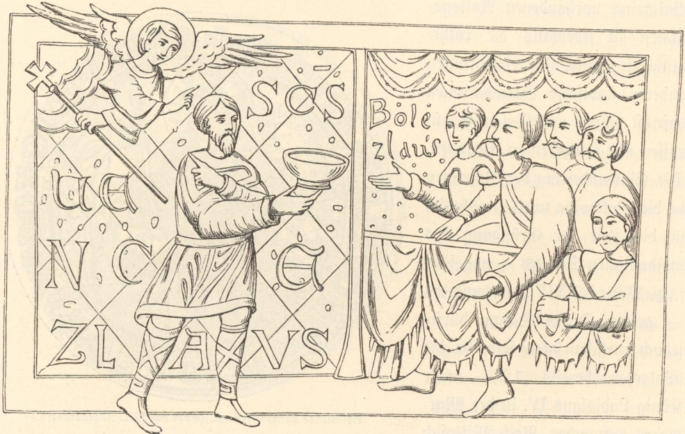
Aus der St. Wenzels-Legende.

Ein Blick auf die ethnographische Karte Eisleithaniens zeigt uns eine compacte Masse deutscher Bevölkerung im Centrum des Reiches. Sie nimmt das Donauthal von