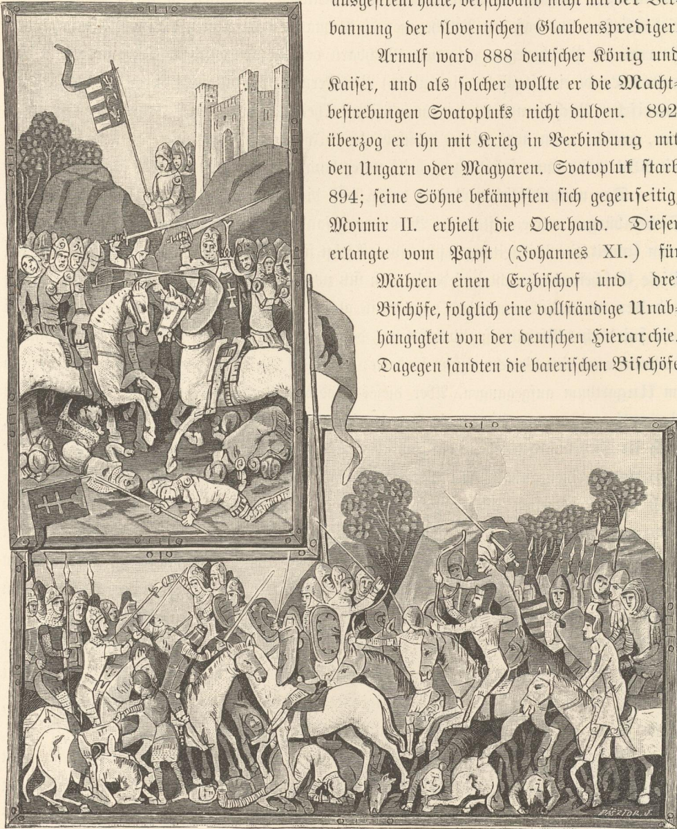
Gefecht bei Rozgony und Attilas Kampf.

Arnulf ward 888 deutscher König und Kaiser, und als solcher wollte er die Machtbestrebungen Svatopluks nicht dulden. 892 überzog er ihn mit Krieg in Verbindung mit den Ungarn oder Magyaren. Svatopluk starb 894; seine Söhne bekämpften sich gegenseitig, Moimir II. erhielt die Oberhand. Dieser erlangte vom Papst (Johannes XI.) für Mähren einen Erzbischof und drei Bischöfe, folglich eine vollständige Unabhängigkeit von der deutschen Hierarchie. Dagegen sandten die bairerischen Bischöfe