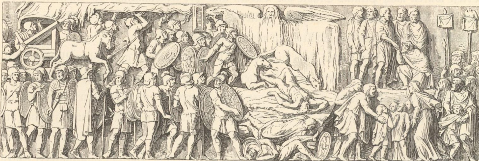
Schlacht im Quadenlande.

Bei den engen, durch die Thäler der Drau und Save gegebenen Wechselbeziehungen in Steiermark müssen wir jedenfalls auch für gewisse prähistorische Epochen ein Über-