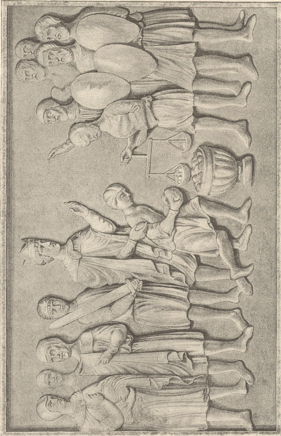
Derjog, Wofessau (Shylock) von Polen läßt den heidnischen Kreutzen den Seidnam des heiligen Abalfort mit Gold anbringen.