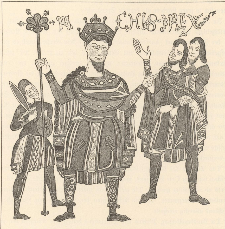
Altlongobardische Tracht aus dem IX. Jahrhundert.

In Kärnten dagegen, wo die slovenische Bevölkerung viel dichter war, wurden wenig neue Ansiedlungen gegründet. Der deutsche Großgrundbesitz setzte sich in den slavischen Ortschaften an, schonte zwar deren Besitz, machte sie jedoch unterthänig und verließ das noch ungerodete Land an seine Stammesgenossen.