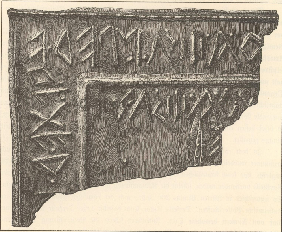
Illyrische Schriftprobe auf Bronzeblech.

Weniger entwickelt scheint die politische Organisation der Alpenkelten gewesen zu sein. Am häufigsten finden wir bei ihnen mehr oder minder lose mit einander verbundene Gaugenosenschaften. Wenn diese letzteren auch mehrfach zur Bildung von Stammeskönigreichen fortgeschritten sind, so weisen sie doch lange nicht die Festigkeit und Widerstandskraft auf wie z. B. die Staaten der Dacier und sogar jene der Illyrier.