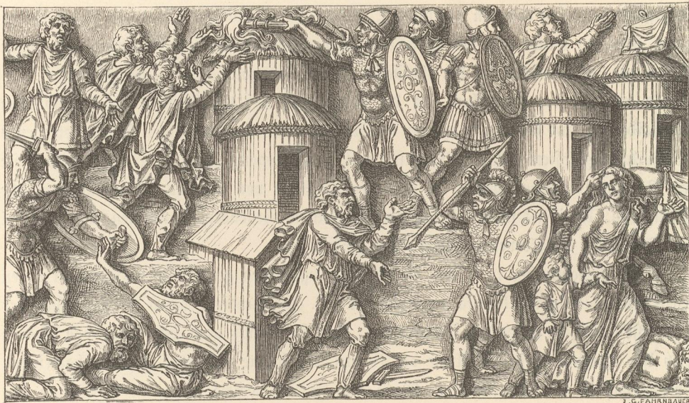
Ansiedlung germanischer Völker.

Vom VII. Jahrhundert an war somit der größte Theil des österreichischen Gebietes nördlich und südlich der Donau mehr oder minder dicht von Slaven besiedelt. In Oberösterreich saßen Slaven im mittleren Ennsthale und im Striche zwischen der Enns und der Traun, weiter westlich kommen sie nur vereinzelt vor. In Steiermark füllten sie das mittlere Ennsthal bis Radstadt, das ganze obere Murthal von Bruck aufwärts, das