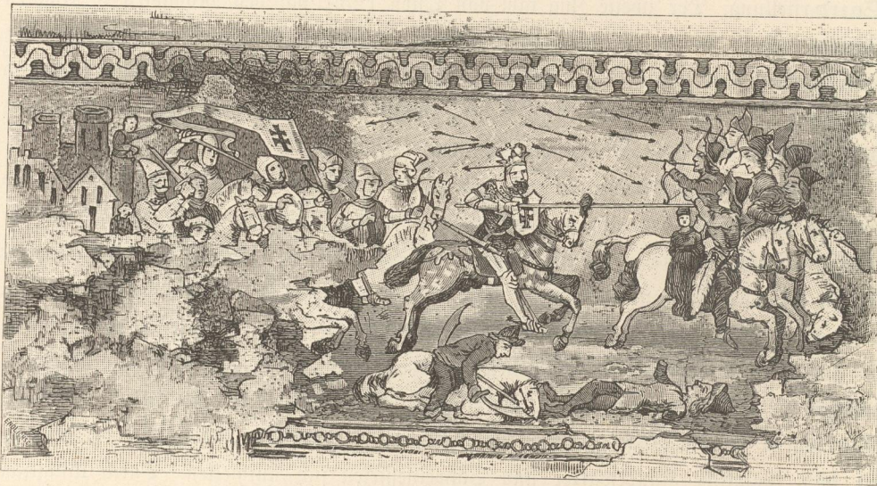
Gefecht Ladislaus des Heiligen mit den Rumänen.

Schon zu Stefan des Heiligen Zeiten kamen von Westen und Osten neue Ansiedler ins Land, von Westen Deutsche, von Osten Bulgaren und Petschenegen; und diese Zuzüge dauerten unter den Arpadenkönigen fort, nur daß nach den Petschenegen die Rumänen in größerer Zahl erschienen. Von Westen kamen zuerst deutsche Ritter, deren Nachkommen