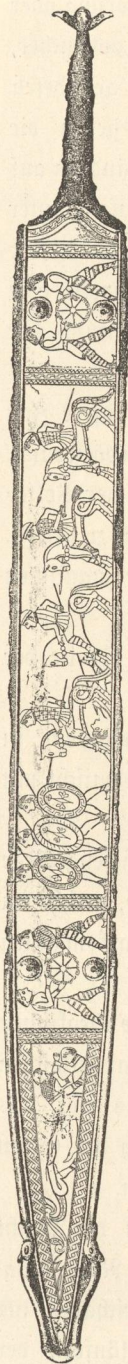
Bronzeschwert aus Hallstatt.

vertreten waren. Die Eroberung Daciens durch Trajan 102 bis 107 veranlaßte viele Dacier zur Auswanderung nach Galizien. In der heutigen Bukowina finden wir zu jener Zeit, im II. Jahrhundert n. Chr., die der thrakischen Völkerfamilie angehörigen Kistoboken unter eigenen Königen. Der Name der thrakischen Bessen (Βέσσοι) ist in der Benennung der Beskiden erhalten geblieben.