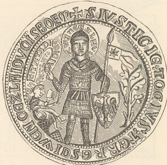
Böhmisches Landrechtssiegel. (Ende des XIII. Jahrhunderts.)

ebenfalls von der Krone besonders begünstigt wurden, der polnischen Nationalität zugeführt worden sein. Unter der österreichischen Herrschaft fanden zahlreiche Colonisationen und Ansiedlungen von Deutschen auf dem ganzen polnischen Gebiete, besonders aber in dem ruthenischen Theile desselben statt. Die jüdische Bevölkerung Galiziens beträgt zehn Percent der Gesamtpopulation. So scharf diese ethnographische Gruppe auch abgegrenzt scheint, muß doch hervorgehoben werden, daß nach den neueren anthropologischen Untersuchungen der polnische Israelit in physischer Beziehung absolut verschieden vom spanischen Juden ist und höchst wahrscheinlich gar nicht zur semitischen Völkerfamilie gehört. Von den in der Bukowina vorhandenen Nationalitäten ist jedenfalls die ruthenische die älteste. Von Bruchstücken anderer slavischer Nationalitäten daselbst wären noch Polen, Großrussen und Slovaken zu erwähnen. Die Einwanderung der Rumänen in die Bukowina wird gewöhnlich in die Zeit der Gründung des moldauischen Staates — ungefähr in die Mitte des XIV. Jahrhunderts — gesetzt. Dieses Datum dürfte jedoch zurückzurücken sein, da die Walachen bereits 1284 unter König Ladislaus IV. in der Mar-