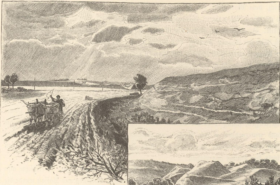
Warenring von Bény bei Gran.