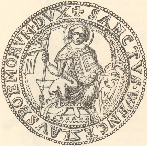
Seigel Přemysl Ottokars I. (1214.)

Diese der Culturentwicklung Böhmens förderliche Verstärkung des deutschen Elementes führte jedoch nicht zur Entnationalisirung der czechischen Bevölkerung; sie regte dieselbe zum geistigen Wettkampfe mit dem Deutschthum und zur kräftigen Pflege ihrer Nationalität,