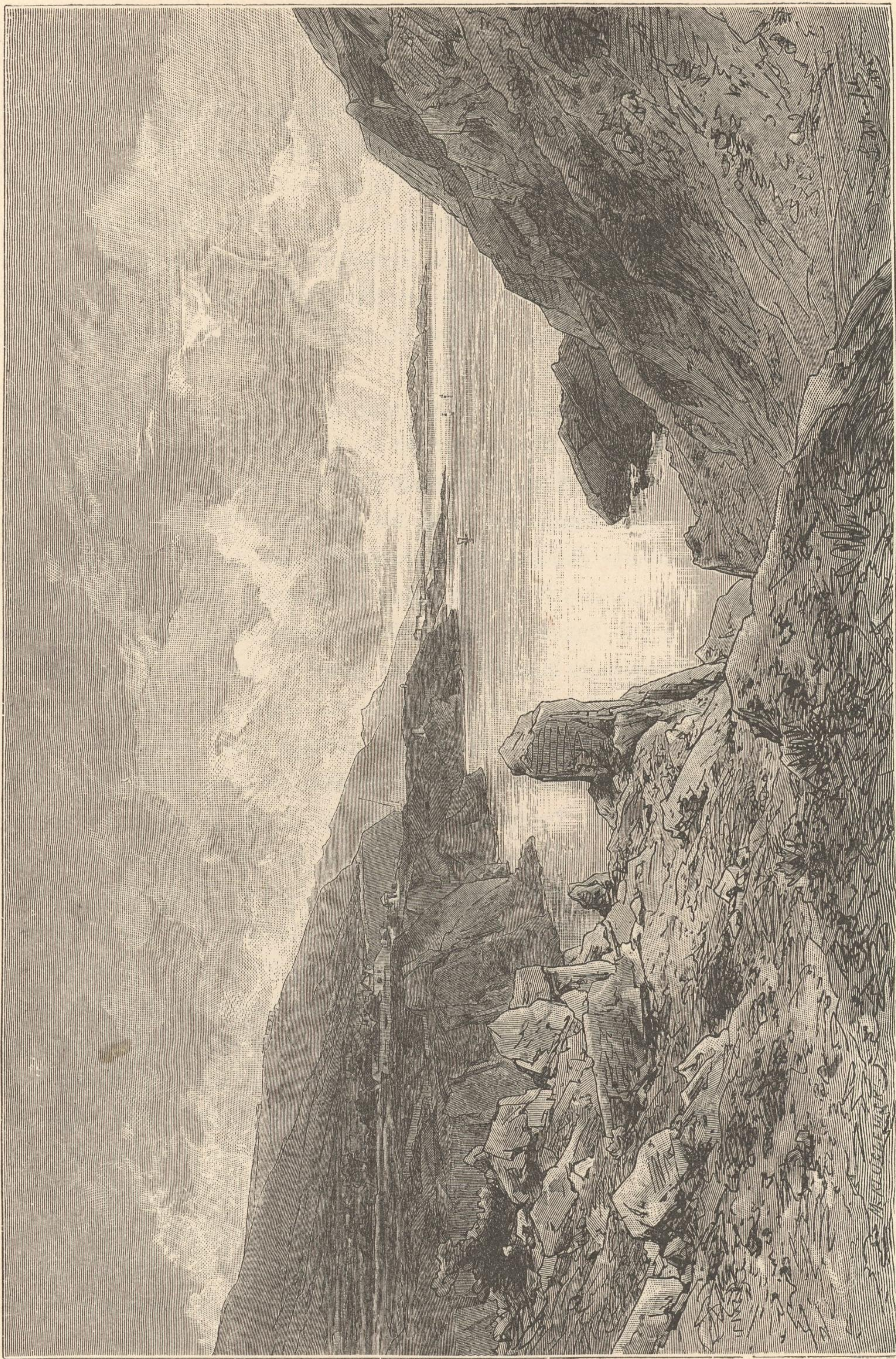
Zwischen Gravosa und Ragusa.