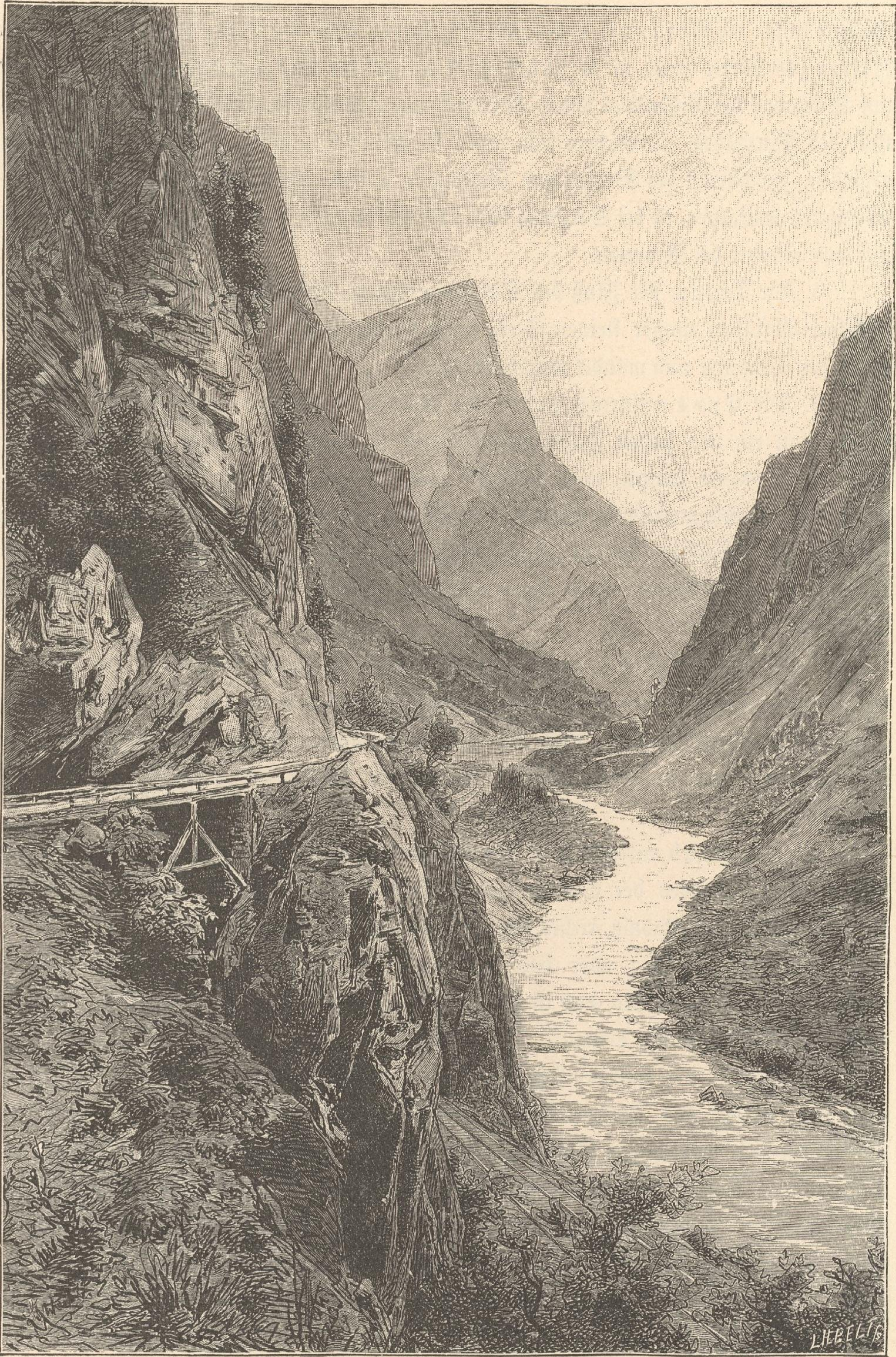
Der Ennsdurchbruch bei Hochsteg (Gesäuse).