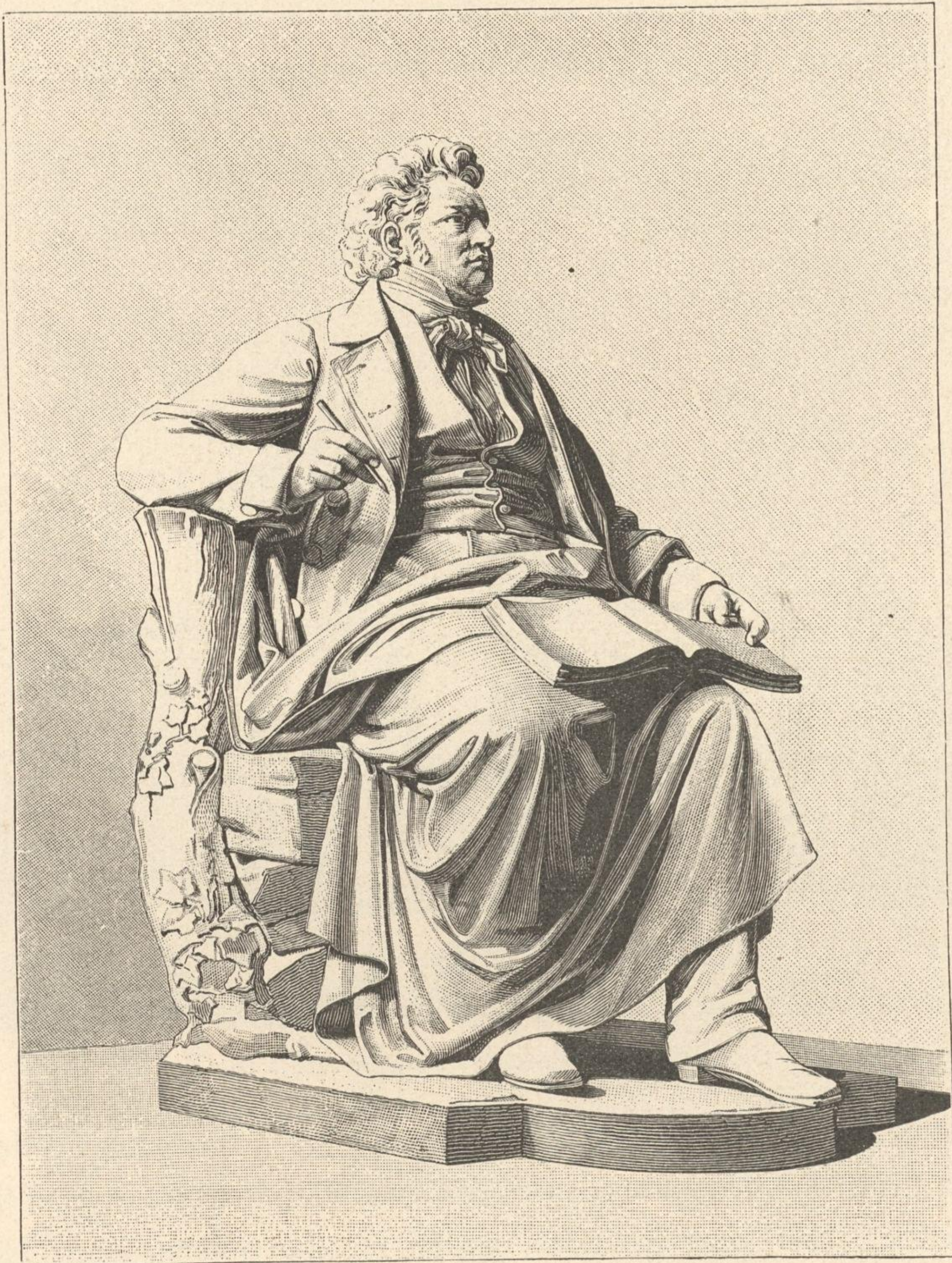
Das Schubert-Denkmal im Wiener Stadtpark.

Nach Beethovens und Schuberts Tod — Welch langer Stillstand der musikalischen Schöpferkraft in Österreich! Der Kranz großer, weltbeglückender Tondichtung war für