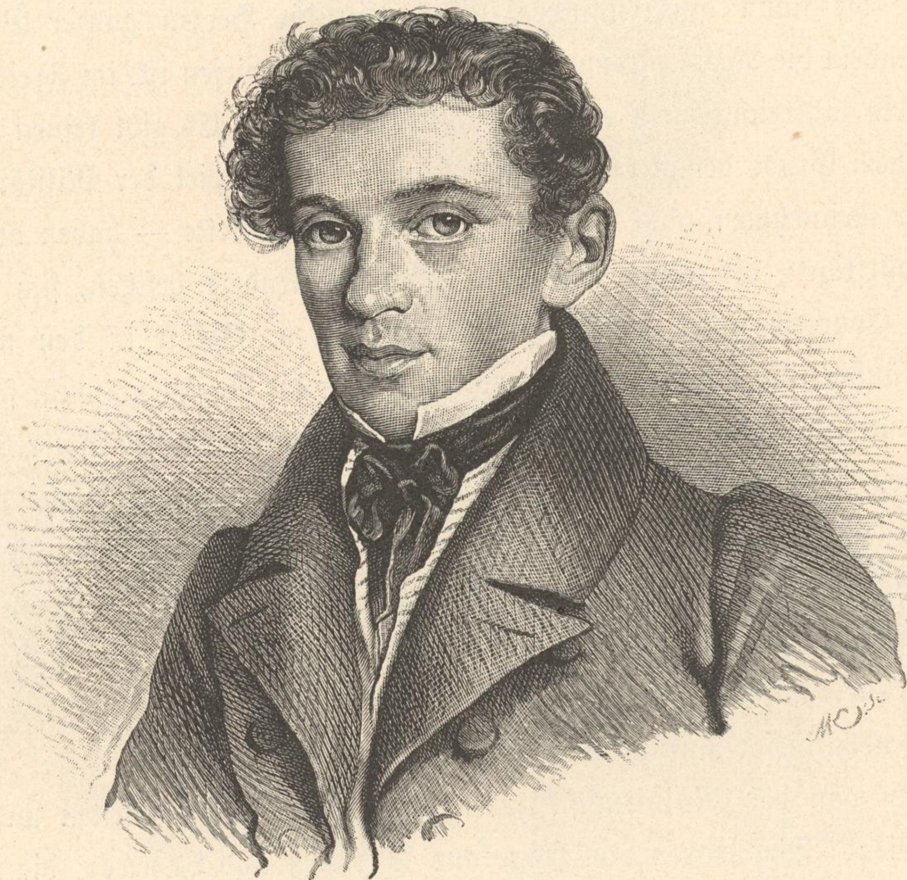
Johann Strauß (Vater).

Die prächtige Oper und die vollkommensten Concertinstitute, ein kunstfönniger Hof und Dilettantenkreis, sie allein schaffen nimmermehr ein so reich und ursprünglich quellendes musikalisches Leben, wie es das der Wiener seit Menschengedenken ist. Im Volke selbst, in seinem Temperament, seiner Gemüthsart, seinen Anlagen muß der Grundton vibriren, aus welchem die musikalischen Kunstschöpfungen wie harmonische Obertöne sich erzeugen und