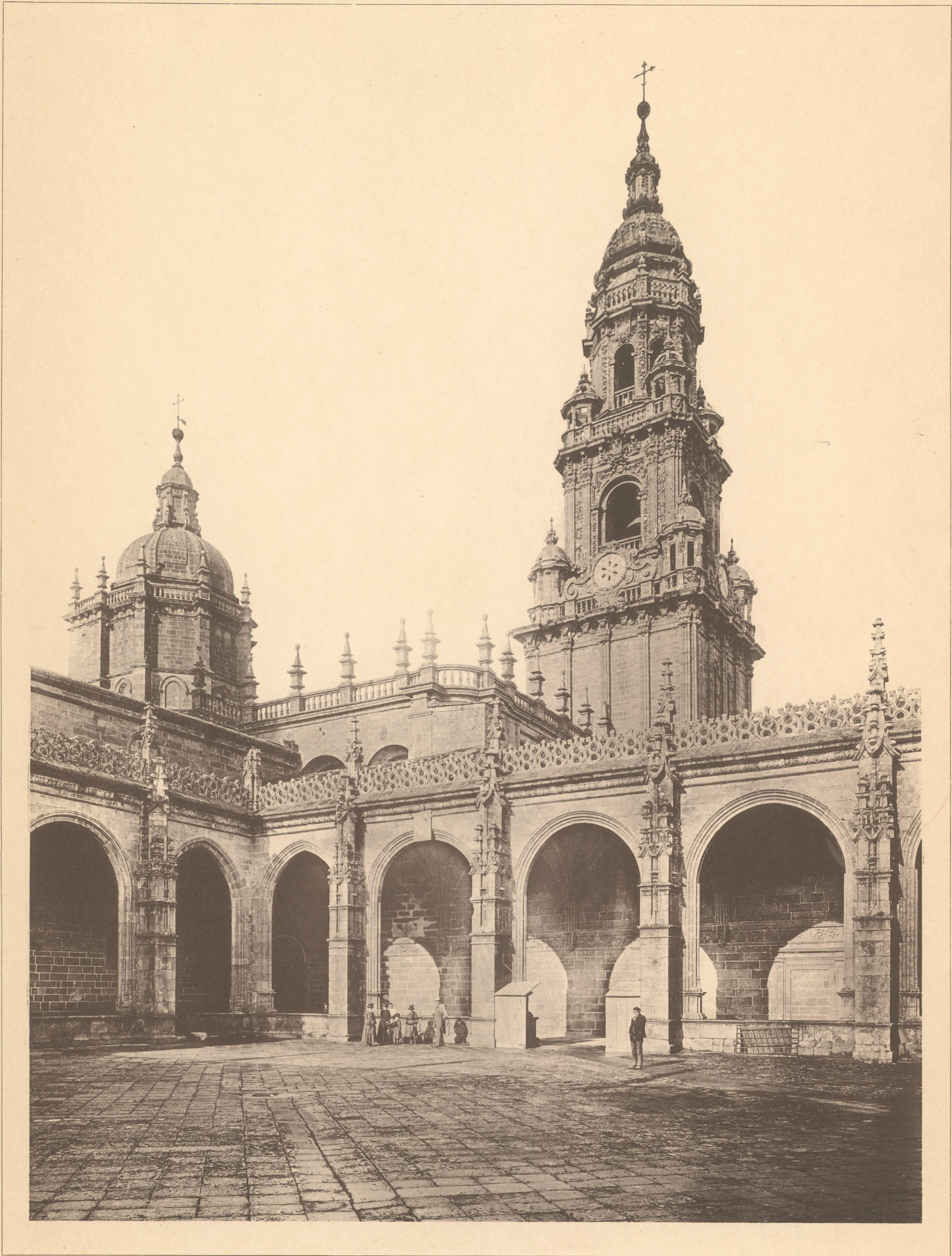
SANTIAGO (DA COMPOSTELA) KREUZGANG AN DER KATHEDRALE

STIL GOIHIK ERBAUT UNTER FONSECA 1520 THUERME VON 1680