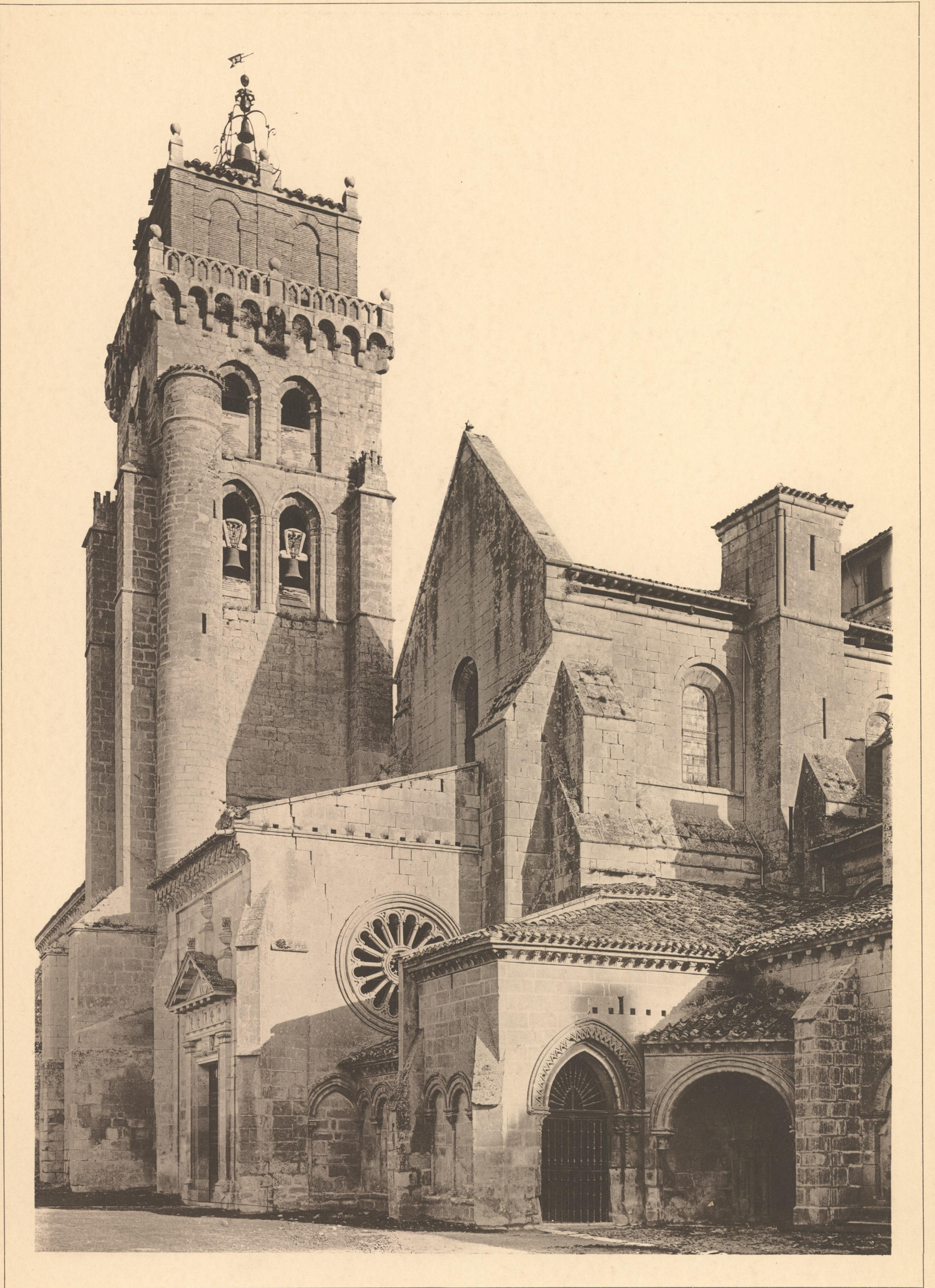
BURGOS DAS KLOSTER LASHUELGAS