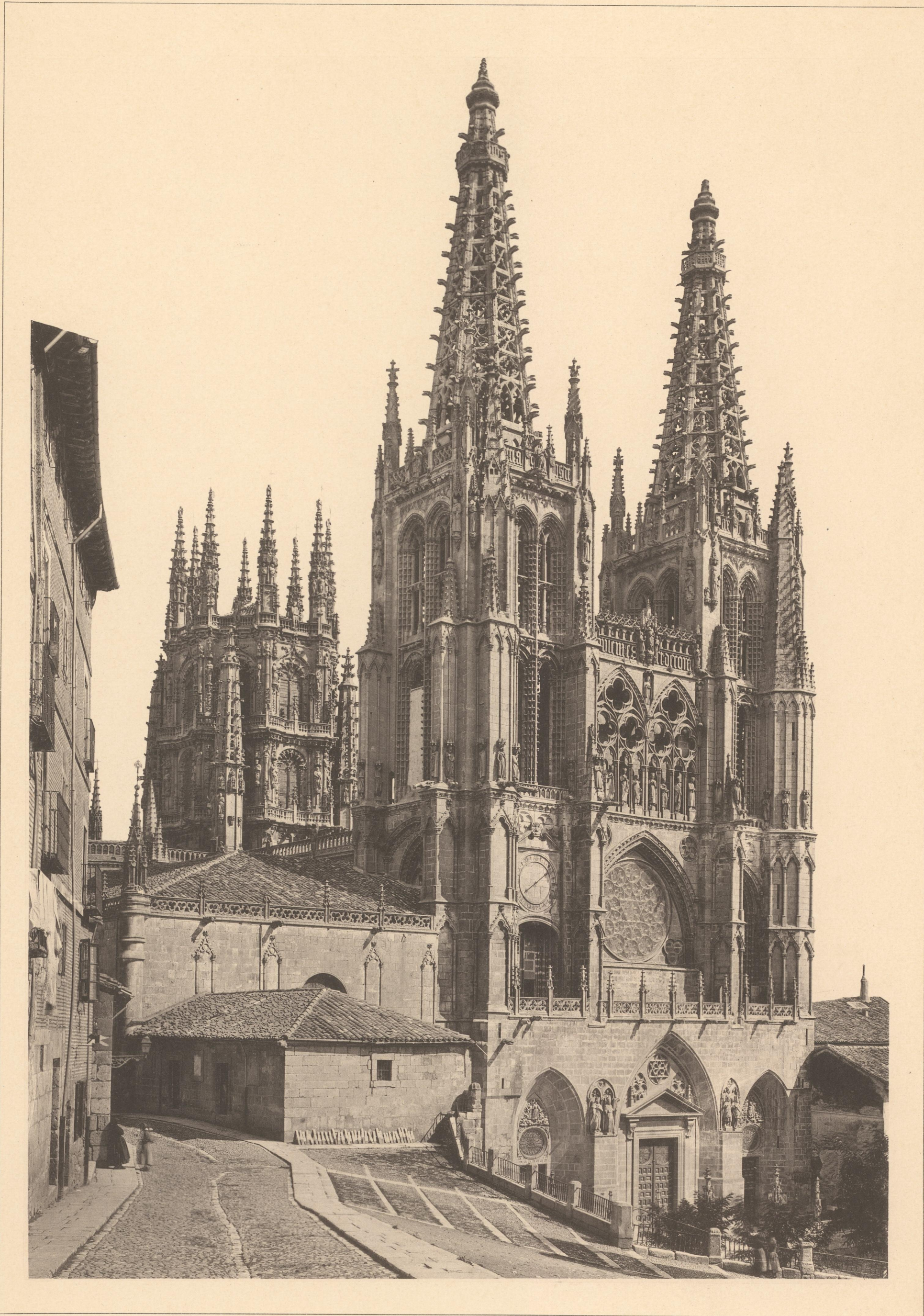
BURGOS DIE KATHEDRALE