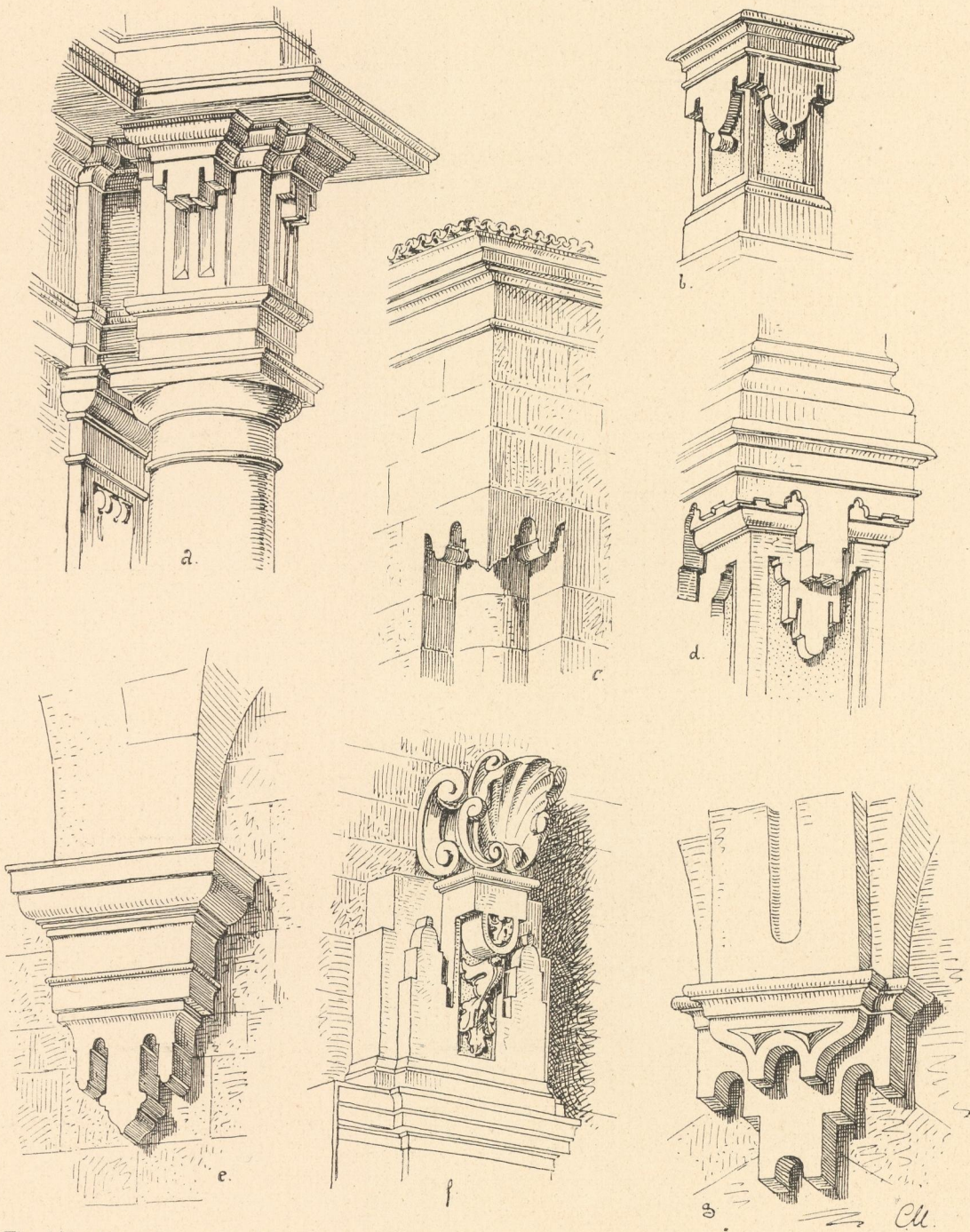
Fig. 149. Einzelformen der Spätrenaissance a, e, f Santiago de Compostela, b, c, d Coruña, g Cordova.

Die bislang in dieser Gruppe genannten Bauwerke werden, bei genauer Vergleichung, gewiss einige Eigentuemlichkeiten und Abweichungen von denen der gleichen Periode anderer Laender zeigen; aber schon die grosse Zahl der auslaendischen Architecten, die derzeit in ganz Spanien und Portugal thaetig waren, lassen die spanische Eigenart selten zur Geltung kommen. Selbst Churriguera's Kirchentabernakel sind denen anderer Laender sehr aehnlich. Nur Don Ventura Rodriguez ging seinen eigenen Weg. Er hatte Verstaendniss fuer feine elegante Verhaeltnisse und lehnte sich im Allgemeinen an die fruehen Formen der italienischen Renaissance, besonders hinsichtlich der zarten Gliederung der Gesimse mit Geschick an. Aber wo er nur irgend konnte, durchquerte er Constructionen und Gesimse mit eigenartig geformten Platten, die durch ihre untere Endigung den Character eines ausgesaegten Brettgehaenges erhielten. Die in Photographie gegebene Hofansicht aus dem Hospital Real zu Santiago, die Kirche San Georg in Coruña und besonders die Zeichnung der siebenaxigen Façade der Plateria in Santiago, welche 1758 erbaut wurde,