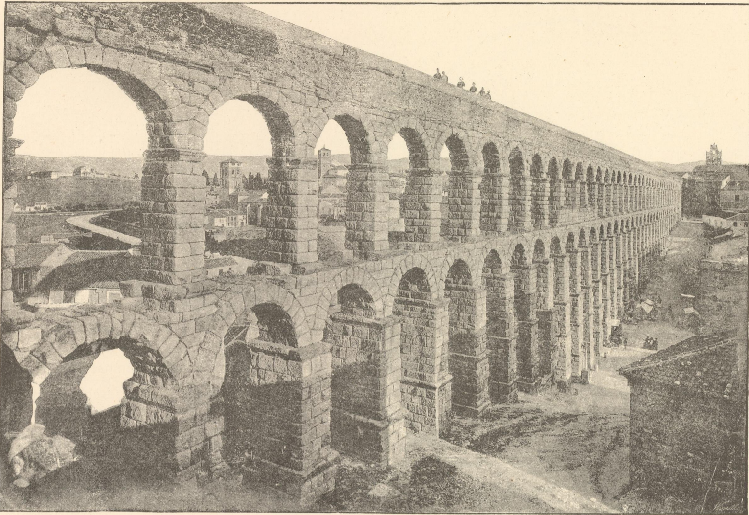
(Fig. 9.) Aquaedukt von Segovia.

Strassenzuege sind noch vielfach erhalten. Von den Bruecken in diesen ist die bedeutendste die von Alcántara („die Bruecke der Bruecken“) ueber den Tajo, deren groesster Bogen eine Spannweite von 33,5 m und eine Hoehe der Fahrbahn ueber dem Spiegel des Flusses von 64 m hat. (Fig. 8.) Die Guadianabruecke von Merida hat eine Laenge von 816 m und ist in dieser Richtung die bedeutendste.