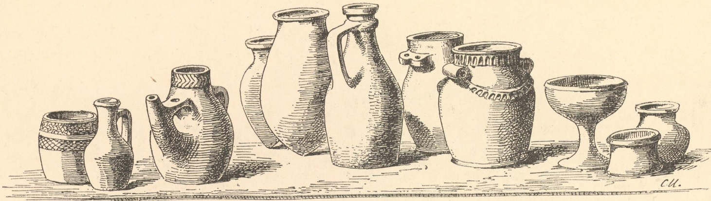
Fig. 5. Præhistorische Thongefässe.