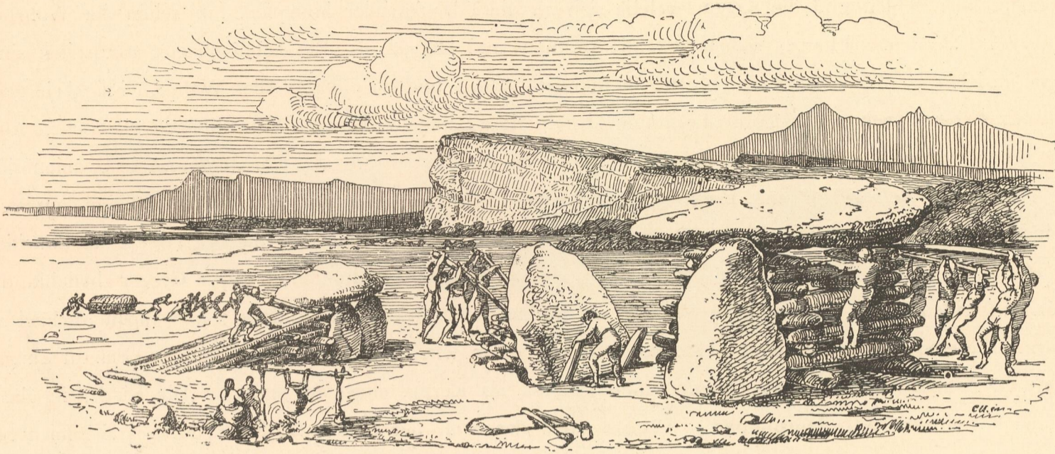
Fig. 3. Erbauung der Dolmen.