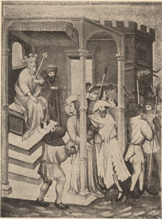
4. Unbekannter Meister aus der Bodenseegegend: Vorführung vor Herodes. München, Bayerisches Nationalmuseum.