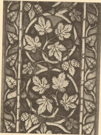
Abb. 214. Glasgemälde-Bordüre aus dem Dome von Regensburg, München, Nationalmuseum.

Wandgemälden die unbeholfene Hand der Gehilfen sich reichlich breit macht, staunt man hier über die Gediegenheit eines streng in sich geschlossenen Stiles. Die leidenschaftliche Glut dieser Farbensprache kleidet sich in einen priesterlichen Ernst und die wildesten Dämonien freien Lebens umhüllt das durchsichtige Dunkel stiller Weiten. Die Berge formen sich aus schimmerndem Kristall, silbrige Steine bauen vielgliedrige Hallen in die nächtliche Stille blauen-der Unendlichkeit, zyklische Leiber leuchten in düsterer Pracht, schmiegsame Kurven umfassen zarte Glieder und langwallende Gewänder begleiten den träumerisch-feierlichen Schritt sibyllenhafter Gestalten. Die derburwüchsige, bäuerliche Welt geht mit oft täppischem Ungeschick der weltmännischen Eleganz der raffinierteren Kultur des Westens nach und sieht doch mit offenem Auge bewundernd auf zu den hier in so seltsamer Größe weiterlebenden,