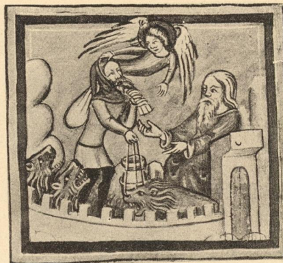
Abb. 261. Daniel in der Löwengrube aus der Weltchronik, cod. germ. 5, fol. 172, München, Hof- und Staatsbibliothek.

geleitet werden, das obere nach unten und das untere nach oben sich schiebt. Im Prinzip begegnet man natürlich einem derartigen formalen Zusammenwirken von Figur und Landschaft auch bei Giotto und andern, aber dort ist ebenso wie etwa beim Meister von Wittingau (Abb. 147) die Landschaft nur Dienerin des eigentlichen Trägers der Ideenwelt, des Figürlichen. Hier erhält dessen zwerghafte Gestalt erst durch die motivische Erweiterung und Fortführung ihres Bewegungsgedankens Kraft und Klarheit. Der Pantheismus verwandelt sich hier in einen Panvitalismus, wie er besonders die jüngsten Generationen in Deutschland beschäftigt. Nicht die metaphysischen Lebensmächte göttlicher Natur bestimmen das Tun der Persönlichkeit, sondern die Natur wirkt da helfend mit der handelnden Person zusammen. Durch die Heranführung der Felsenkurven und Häusersilhouette an das Brunnenmotiv und die Hauptfigur in der Mitte äußert sich eine, an dieser Stelle sich sammelnd, fast wild phantastische Kraft, die deshalb im musikalischen Sinne so unmittelbar wirkt, weil die