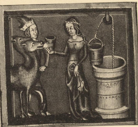
Abb. 263. Rebekka am Brunnen, bayer. (?) um 1370, cod. germ. 5, München, Hof- und Staatsbibliothek.

banale Gegenständlichkeit wie das Panoramatische des Raumes kaum eine Rolle spielt. Durch die Fortführung des Motives rechts vermittle des sicheren Bogens der Mauer und ihre Überleitung in die stille Pracht des über den dunklen Himmel sich verteilenden Raummotivs verflüchtigen sich die starken Gewalten rechts in die Märchenidylle des Hintergrundes. Daß dieser als „Hintergrund“ erscheint, ist das einzige Zeichen des anbrechenden Rationalismus in dem Aufbau des Landschaftsbildes.