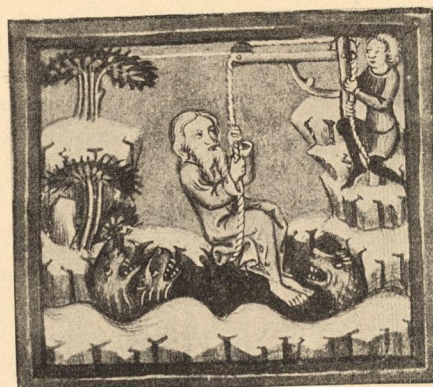
Abb. 264. Befreiung Daniels aus der Löwengrube, cod. germ. 5, fol. 172, München, Hof- und Staatsbibliothek.

Die allmähliche Rezeption des Pragisch-Böhmischen Stiles läßt sich am besten in der Salzburger Armenbibel verfolgen, wo ein Teil der Bilder sich an die Formenwelt des Wittingauer Meisters, ein anderer an die vom Anfang des 14. Jahrhunderts anschließt (Abb. 260). Während vier der in rechteckigen Feldern abgegrenzten Szenarien in derbem Helligkeitswechsel überall den gegenständlichen Einzelheiten zu voller Körperlichkeit verhelfen, sind die beiden unteren Darstellungen entsprechend der älteren Zeichenart nur in gleichförmigen Umrißlinien angelegt.