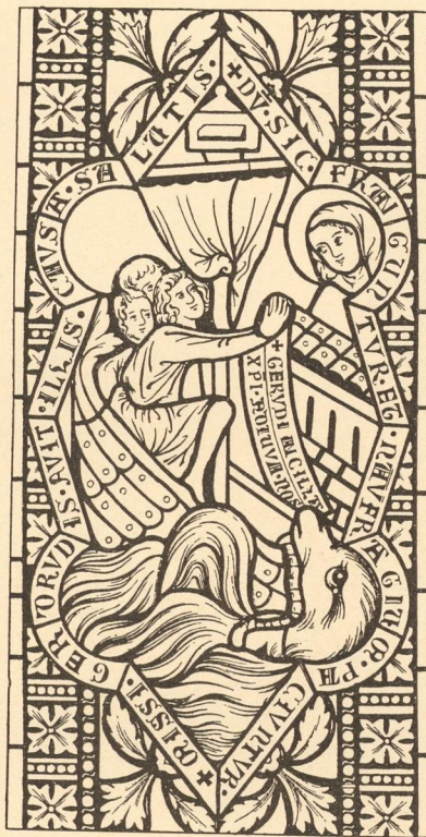
Abb. 227. Szene aus dem Leben der heiligen Gertrud. Glasgemälde um 1360, alte Pfarrkirche in Gars.