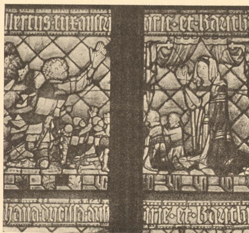
Abb. 229. Fenster mit Albrecht II. von Österreich in St. Florian (1347—49).

Die Tatsache, daß hier beide Stile nebeneinander in einem Werke fortbestehen, läßt erkennen, daß alles überragende Persönlichkeiten hier keine richtunggebende Führerrolle gespielt haben und nur relativ langsam das Alte durch das Neue verdrängt wurde. Allerdings beweist die überraschende Klarheit „perspektivischer“ kühner Raumkompositionen in bekrönenden Zierstücken der Glasfenster am deutlichsten, wie leicht man die Lehren des Westens zu begreifen und