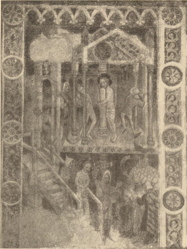
Abb. 222. Stäupung Christi, Fresko, alte Pfarrkirche Garmisch.