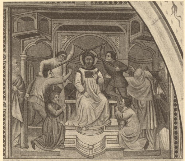
Abb. 224. Dornenkrönung, Fresko, in der Cyprianskapelle in Sarnthein.

Es ist wahrscheinlich, daß ebenso wie das Prinzip auch das Gestaltungsmaterial der an oberitalienische Mosaizistenarbeit erinnernden Architekturen auf eine uns unbekannt Quelle des Südens jenseits der Alpen zurückgeht, die in viel unmittelbarerem Zusammenhang mit italienischen Schulen gestanden haben muß, als alle ähnlichen erhaltenen gleichaltrigen Werke des tirolischen oder bayerischen Kreises um 1420 2) . Unter der dürftigen Hülle volkstümlichen Wesens schimmert der edle Glanz südlicher Renaissance hindurch. Die wohlberechneten sich entsprechenden Posen in den zu Straßenjungen gewordenen „Kriegsknechten“! Auch das bißchen Gotik in den langgestreckten Räumen mit den dünnen Säulen spielt bei solch stillem Gleichmaß aller Raumlmitglieder (die vielen horizontalen) kaum eine Rolle. Die starke panoramatische Erweiterung des Bühnen-