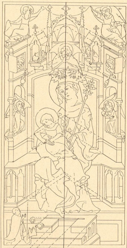
Abb. 213. Schema der Konstruktion nach Abb. 159.