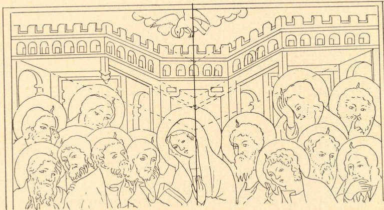
Abb. 207. Konstruktionsschema eines Ausschnittes aus dem Gemälde der Ausgießung des hl. Geistes des Meisters d. Hohenfurth. Heilszyklus.