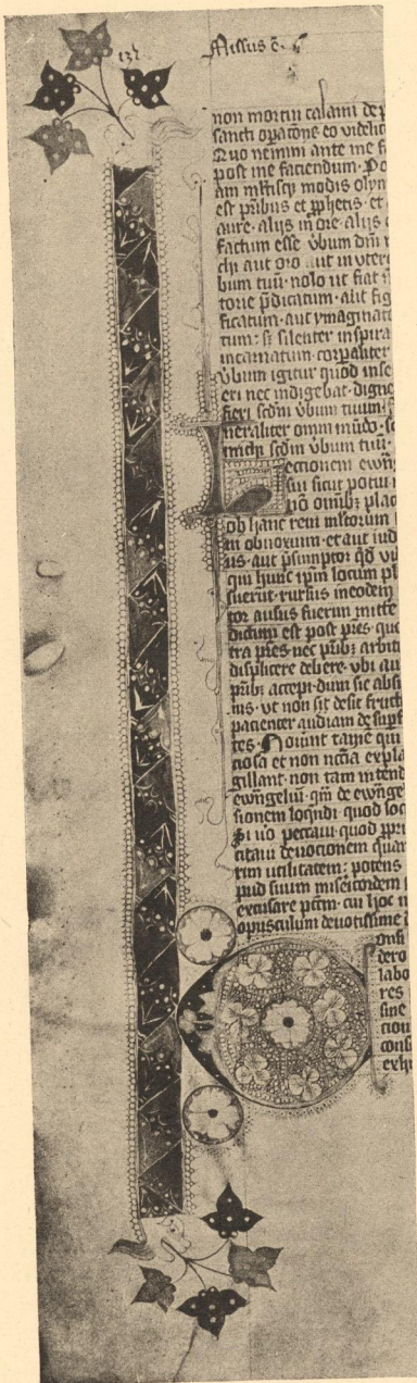
Abb. 140. Randleiste aus den Schriften des Bernhard von Clairvaux. Muses. XII. A. 15 des Böhmisches Landesmuseums.